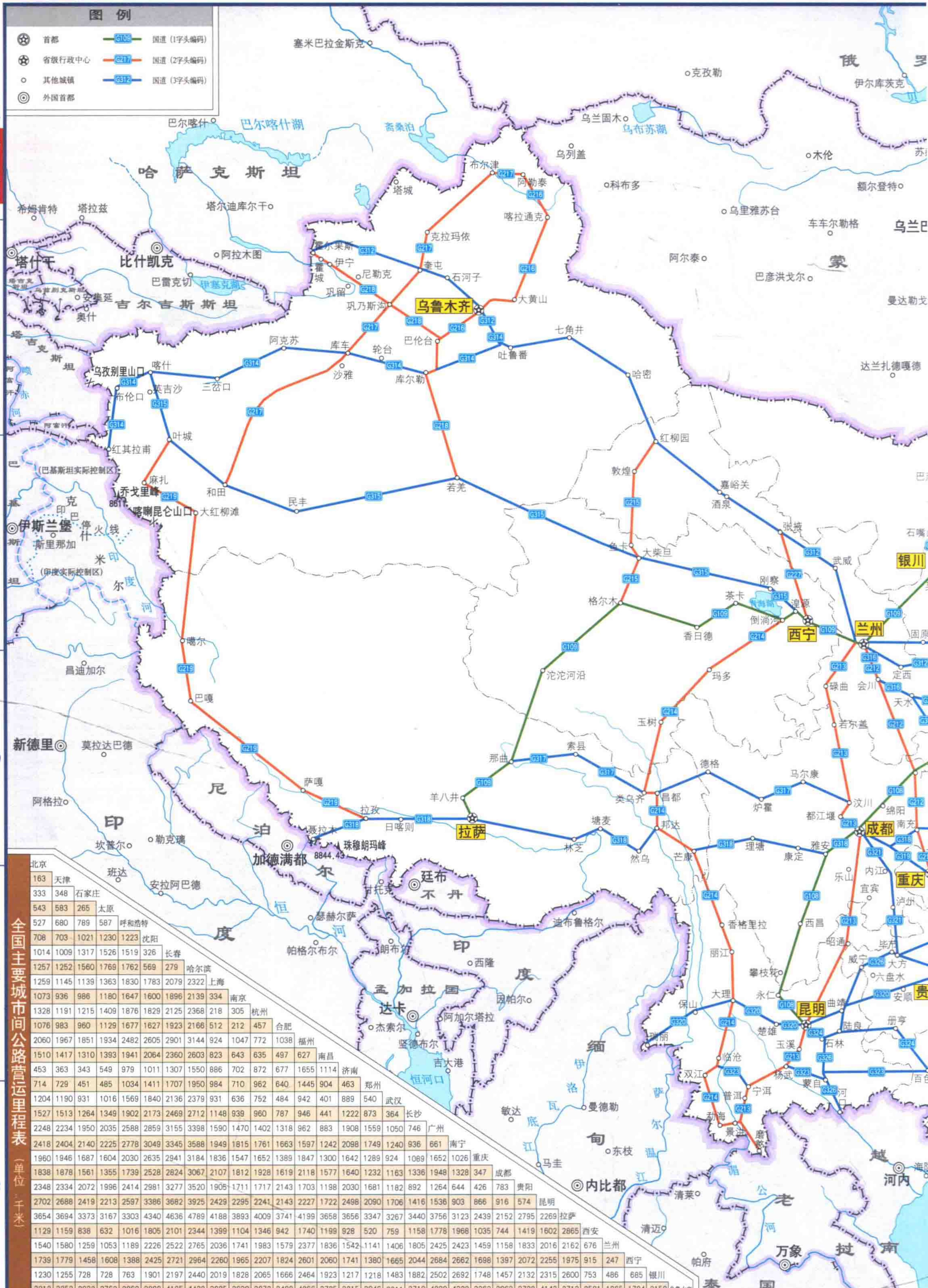
全国主要城市间公路营运里程表 (单位:千米)