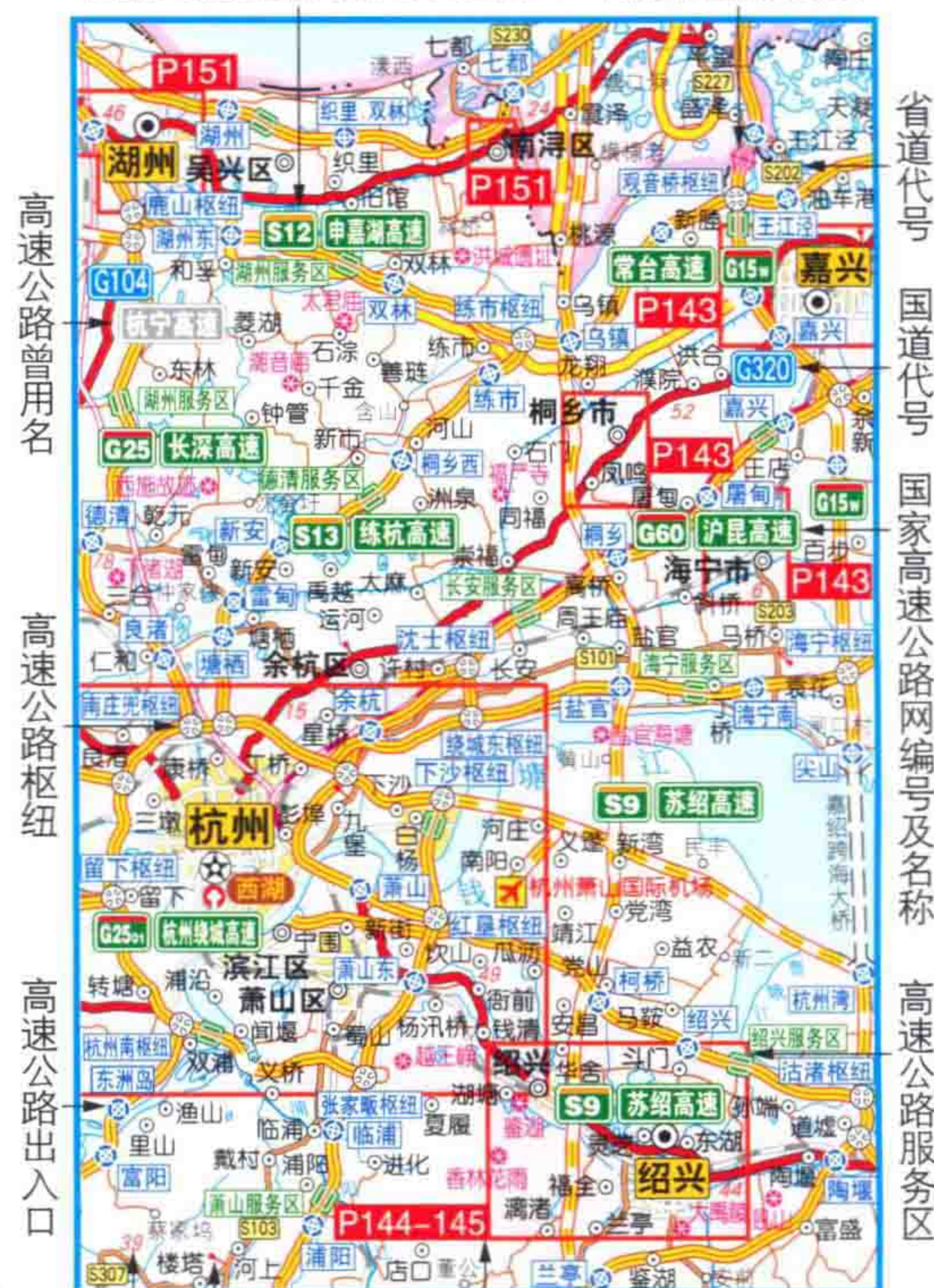
省级高速公路网编号及名称 高速公路收费站