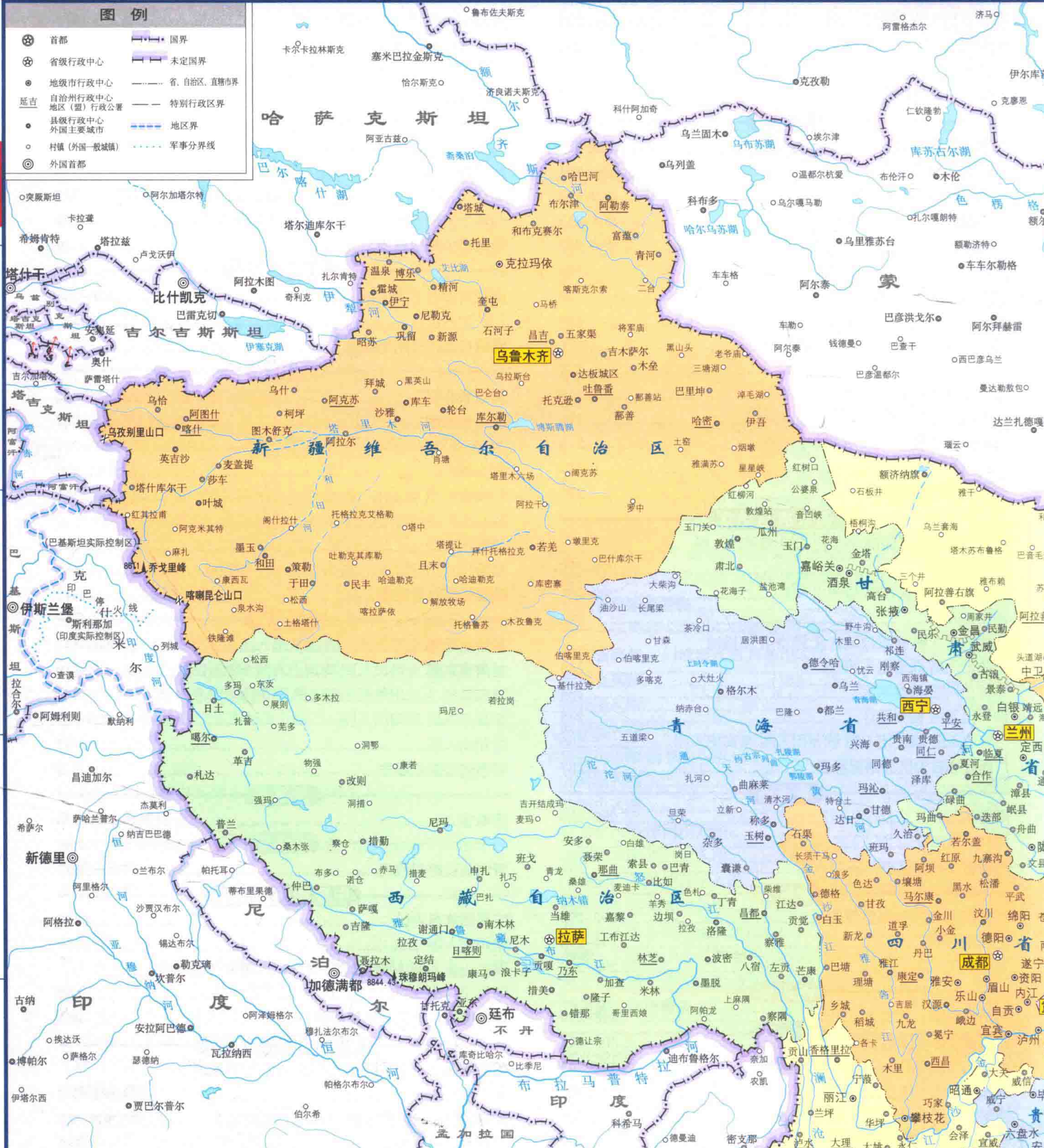
全国行政区划统计表