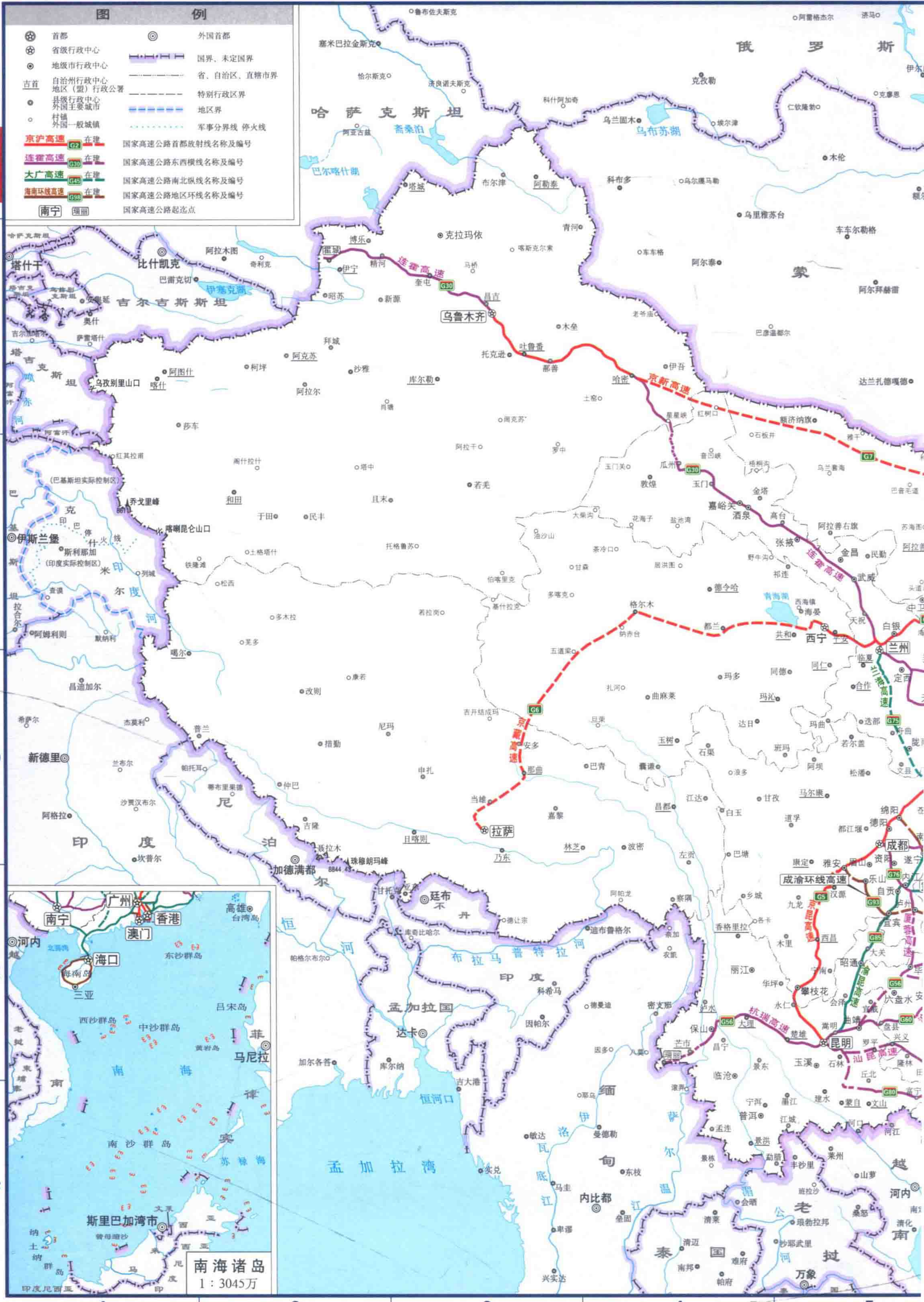
南海诸岛 1 : 3045万