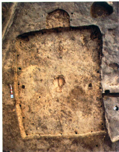
第二期房址AIVF3 House-foundation AIVF3 of Phase II