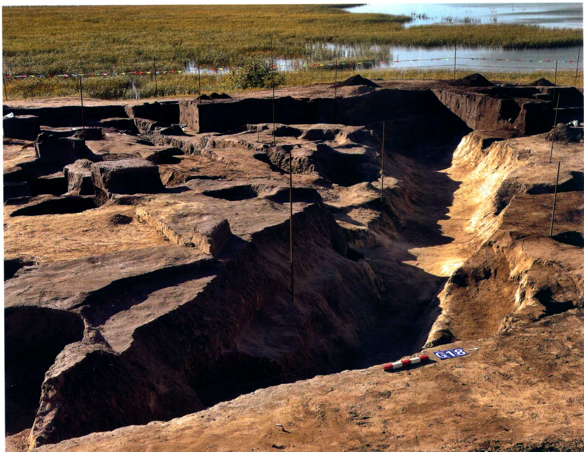
第一期灰沟AIIIIG18 Ash-trench AIIIIG18 of Phase I