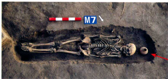
第四期墓葬AIII M7 Tomb AIII M7 of Phase IV