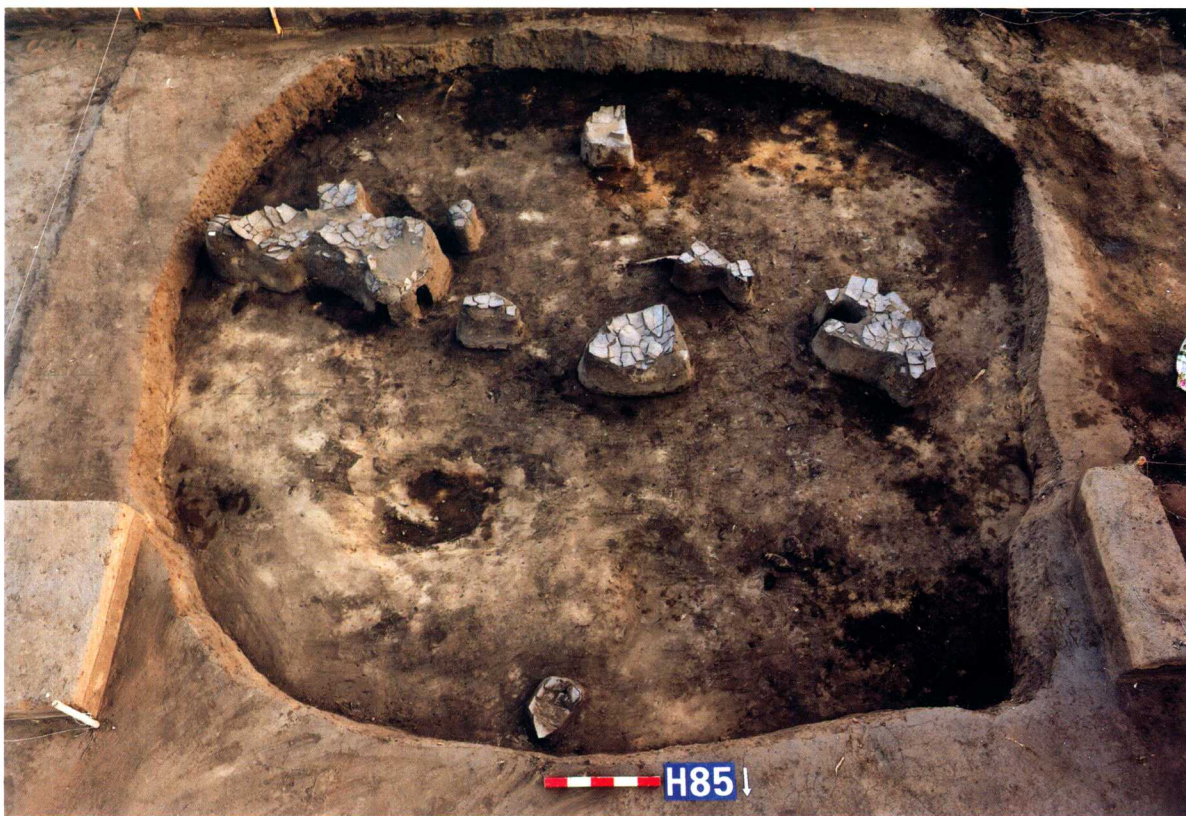
第二期灰坑AIII H85 Ash-pit AIII H85 of Phase II