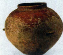
第五期墓葬出土陶器 Pottery from Tombs of Phase V

The Houtaomuga Site is located on a gentle hill about 1.5 km to the northwest of Yonghe Village of Honggangzi Township in Da'an City, Jilin Province. In 2011—2012, the Borderland Archaeological Research Center of Jilin University and the Jilin Provincial Institute of Cultural Relics and Archaeology carried out two seasons of initiative excavation on the site, which resulted in the revelation of 100 tombs, 312 ash-pits, 32 ash-trenches, 12 house-foundations and abundant objects in the opened area of 2,355 sq m. The cultural layers can be divided into six phases, of which Phase I