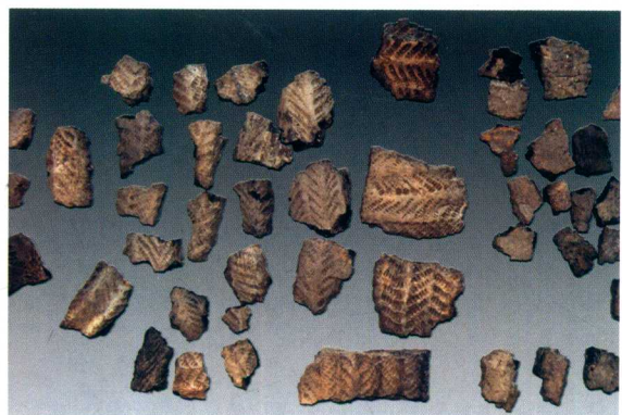
第一期出土陶片 Pot-sheds of Phase I

少量饰麻点纹或“之”字纹。器形有双耳罐、筒形罐、钵等。此期遗存应与白城双塔二期和科左中旗哈民忙哈遗存属于同一种考古学文化，年代与辽西地区的红山文化大体相当。