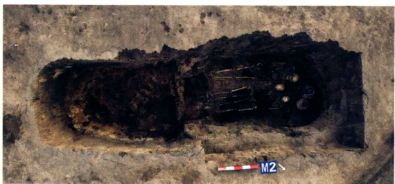
第五期墓葬AIV M2 Tomb AIV M2 of Phase V