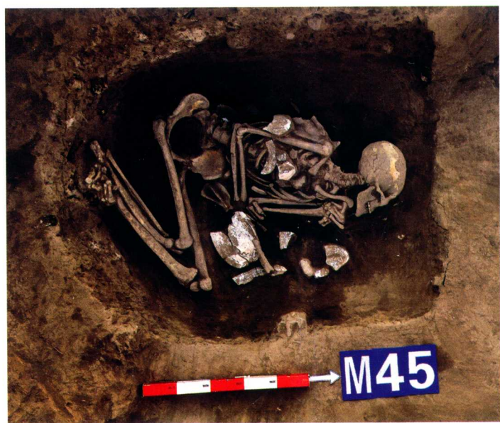
第一期墓葬AIIIM45 Tomb AIIIM45 of Phase I