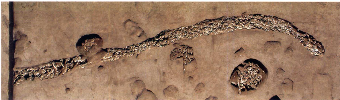
第三期灰沟AIV G2 Ash-trench AIV G2 of Phase III