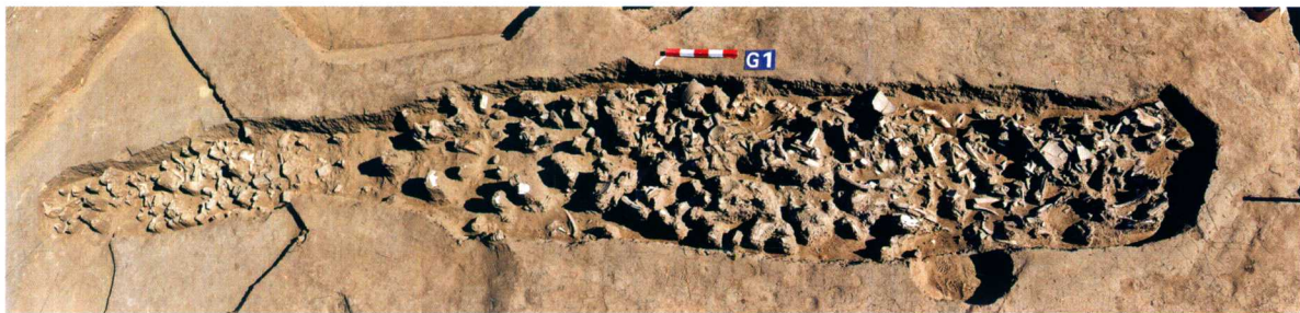
第二期灰沟AIII G1 Ash-trench AIII G1 of Phase II