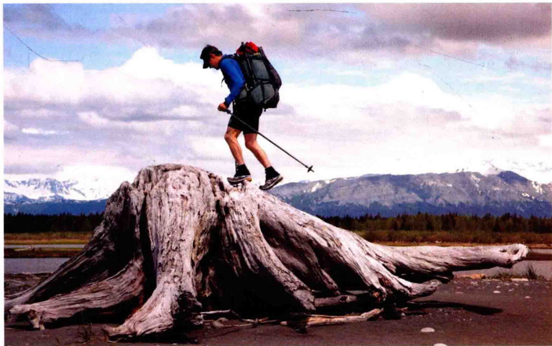
我在沿着阿拉斯加的失落海岸进行一趟长达800千米的徒步旅行时，碰到一个巨大的西加云杉树干。

无论是通过以往的经验还是行前调查，他们对旅途上可能遭遇的环境和路线状况都非常了解。因此他们有办法只带必需物品，而不是带上一堆东西以防万一。