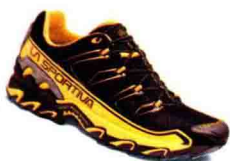
16 为何我是“终极 徒步旅行者”