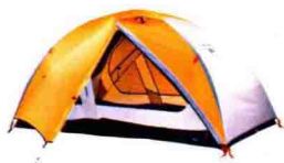
10 你是徒步旅行者 还是露营者