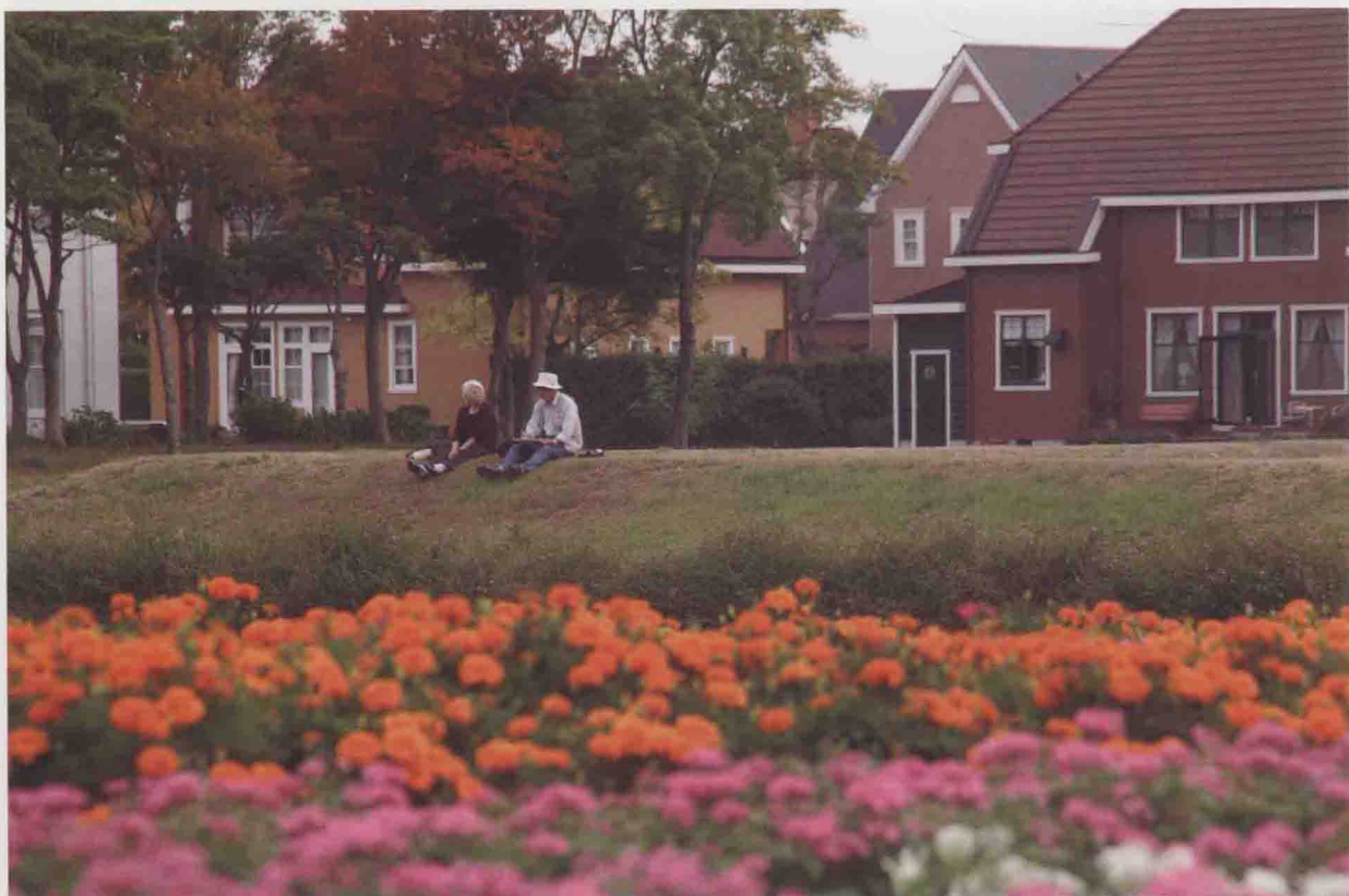
尼康-D300, 光圈优先AE (F8), 曝光补偿-0.3EV, WB; 自动, ISO400