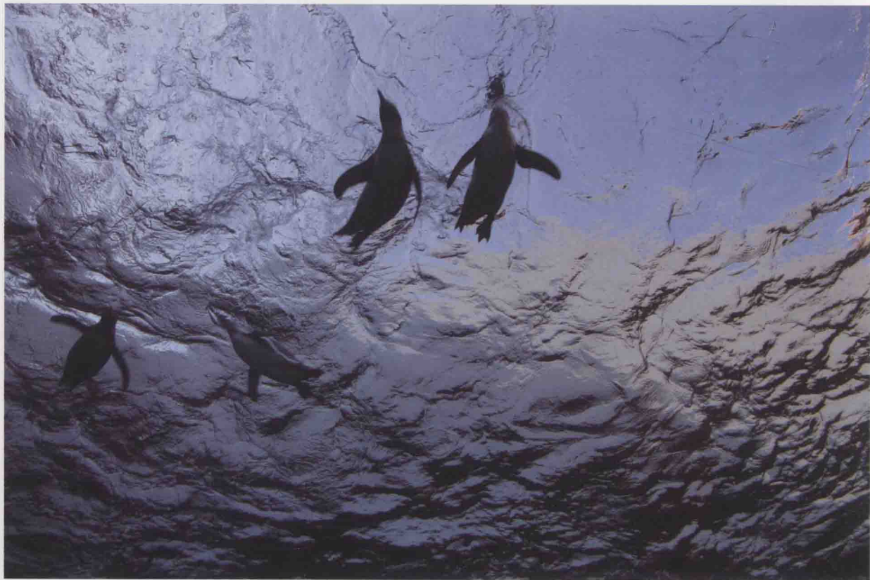
佳能·EOS 7D, 光圈优先AE (F8), 曝光补偿+0.3EV, WB: 自动, ISO自动 (ISO100)