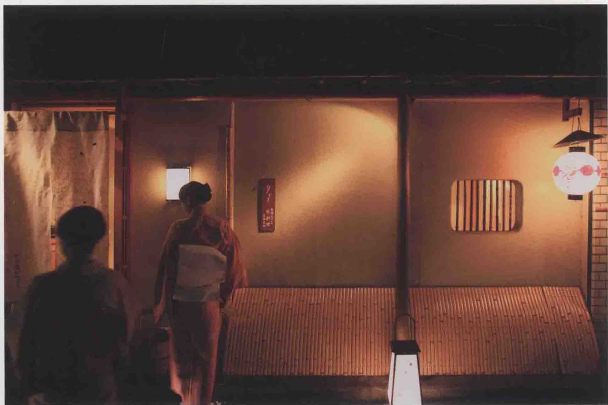
索尼·α 900，光圈优先AE (F2.8)，曝光补偿-0.3EV，WB：日光，ISO800