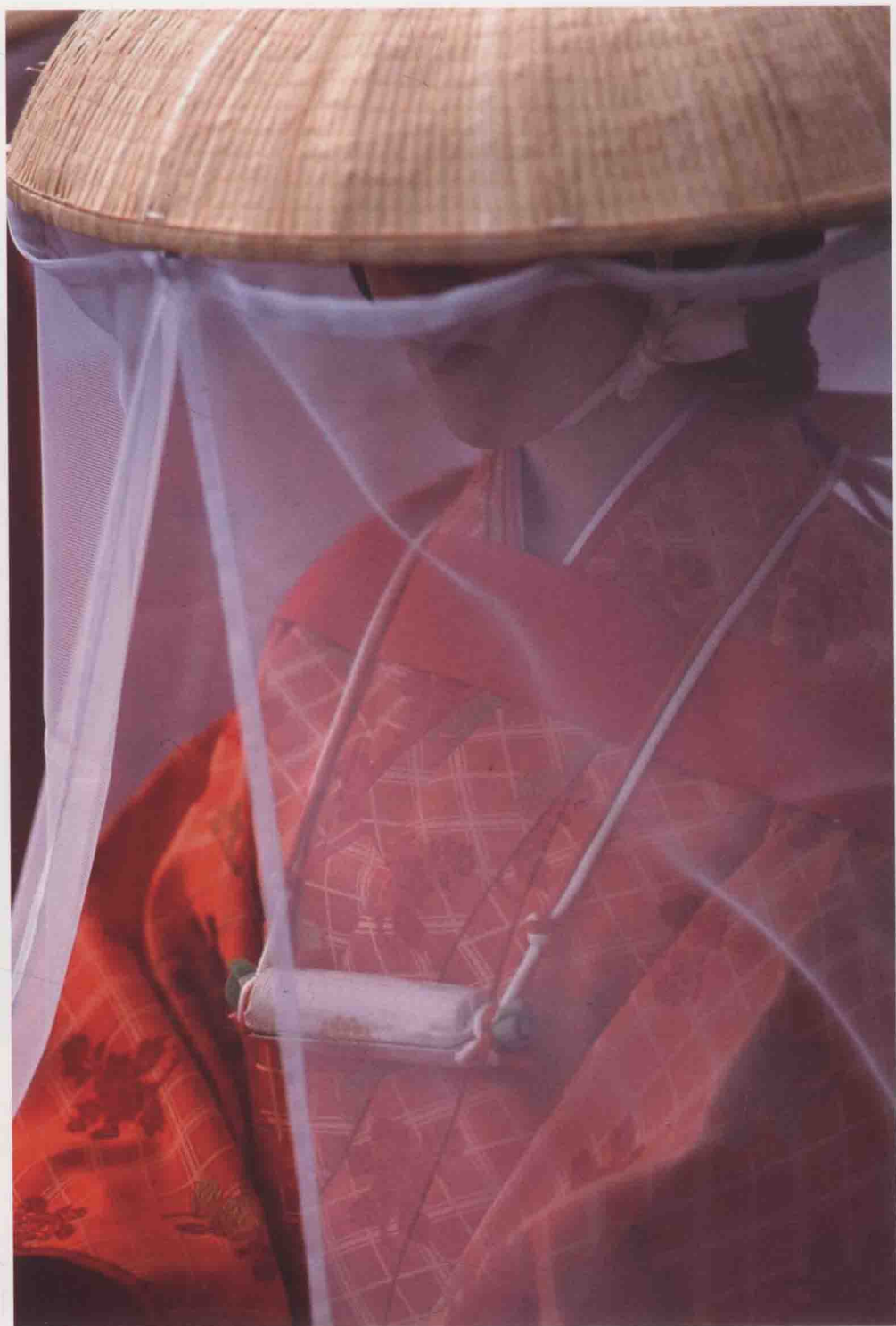
宾得-K-x, 光圈优先AE (F2.4), 曝光补偿-0.3EV, WB: 自动, ISO自动 (ISO400)