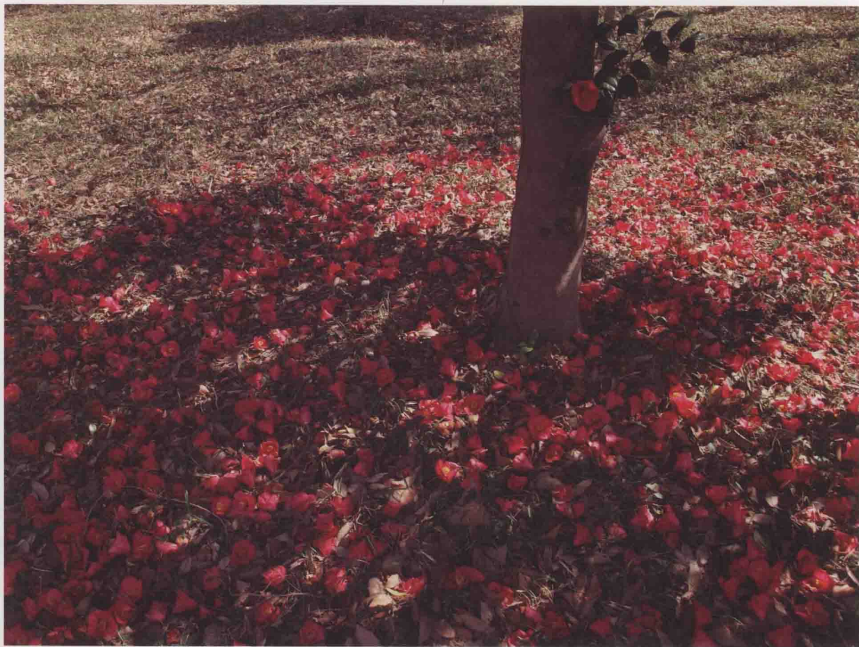
奥林巴斯·E-PL1, 光圈优先AE (F8), 曝光补偿 -0.3EV, WB: 自动, ISO200, 内置闪光灯 (闪光曝光补偿 -0.7EV)