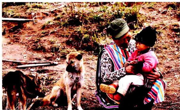
奶 与 孙