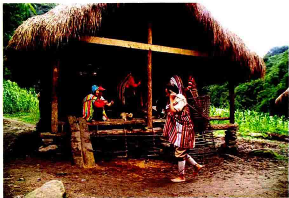
村 里 的 劳 作