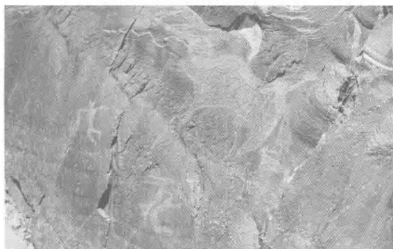
西部岩画,猎野牛图。野牛形态逼真,并强悍健壮,进击的猎人往往凿得很小。

西部岩画中,最大量的是与中亚岩画相同的符式,即大弯双角的北山羊。在新疆的北疆、南疆,乃至内蒙古西部的沙漠地带,都有大量的分布,我认为,是从阿尔泰地区传播过来的。这符式的源头,也许深藏在蒙古或俄罗斯境内的草原沙漠的腹地。其向东扩展,最远可达内蒙古的东部。可以认定,它是一种典型的草原岩画,符式虽然简单,却有极强的内在固定性。故其即使纵横万里,图式亦不变。