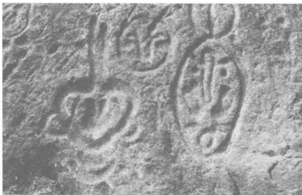
人面岩画。显示出神格的特征(宁夏贺兰山)。

《山海经·海外南经》记南方有羽民国。云南沧源岩画中的，确发现画有很多双臂遍饰羽毛，作飞翔状的人像。