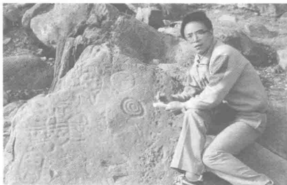
作者实地考察岩画。

故事,以激起对史前或原始文化艺术的激动。这种激动,对于一个当代人来说,已是难能可贵了。