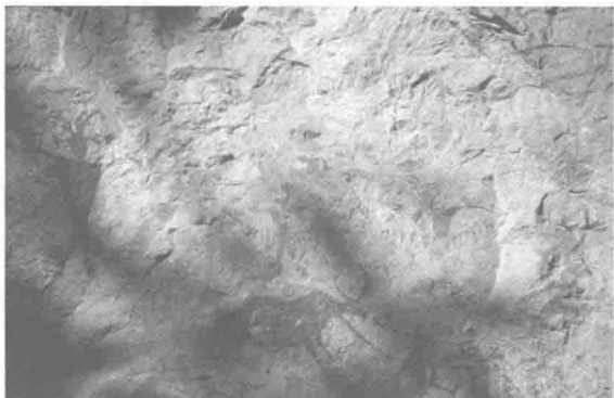
羽人岩画。伸展的双臂间遍饰羽毛，作飞翔状，与神话深刻对应（云南沧源）。