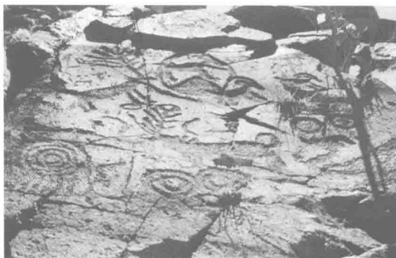
北部岩画。太阳、鹿、羊、人面图,采用磨刻法制出,为北部岩画中精品。

北部岩画的区域主要包括北方的内蒙古、宁夏、甘肃的东南部、江苏的北部。其主要作画技法是采用石器为工具,在深山幽谷裸露在外的石壁上,磨刻镌凿图像而成。到晚期也有采用金属工具制作的,包括青铜器。