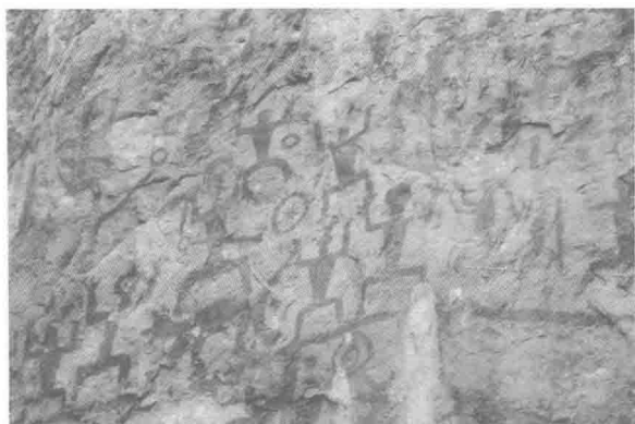
南部岩画,拜祭图。天然赤铁矿作色料,千年不褪。

都在距今三千年至两千年之间。这个数据与用综合分析法得出的结论相一致,看来是较为可靠的。