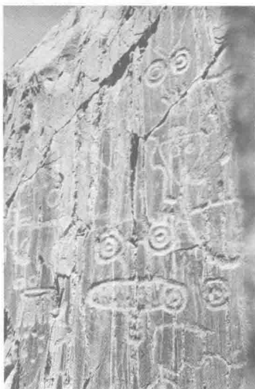
古人在深山石壁上磨制的岩画 (内蒙古阴山)。