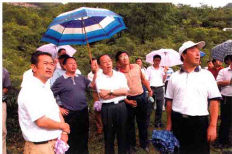
省市县领导展望桐梓明天

何谓旅游文化？旅游与文化的关联何在？如何认识与对待旅游与文化的关系？这是一个重要的问题，普遍的问题，带根本性的问题。