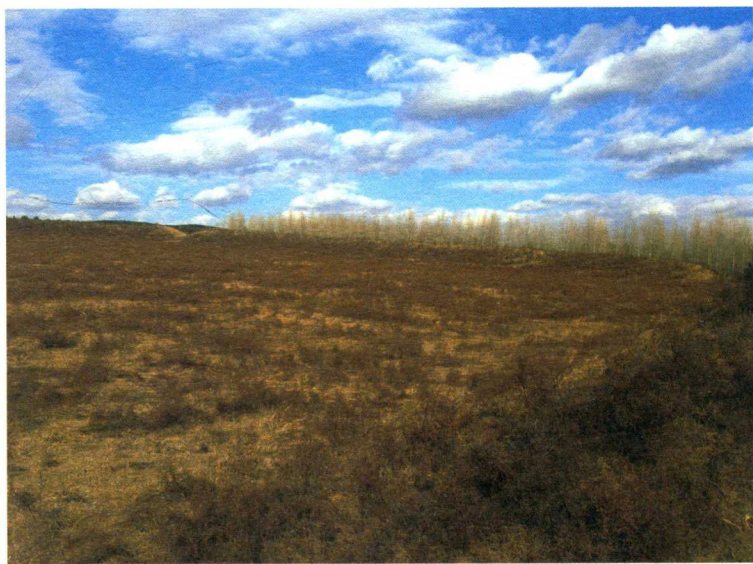
碾子山丰荣古城遗址