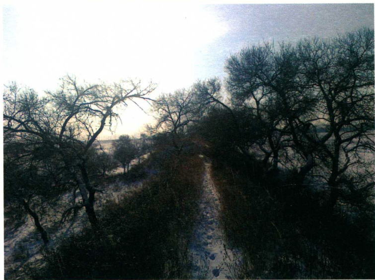
肇东八里城南城墙