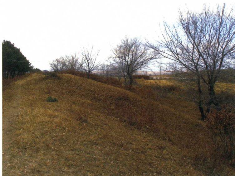
齐齐哈尔碾子山金界壕马面