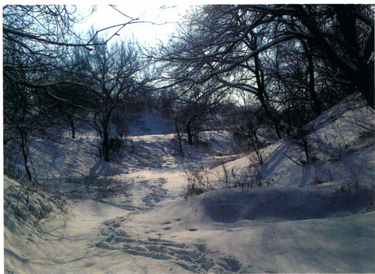
肇东八里城北护城河