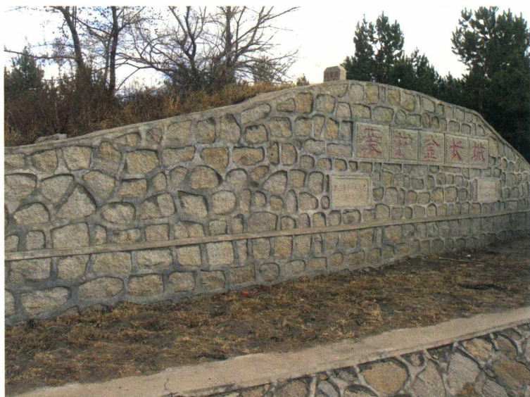
齐齐哈尔碾子山金界壕遗址