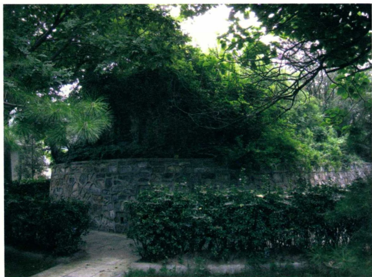
金中都凤凰嘴城墙遗址