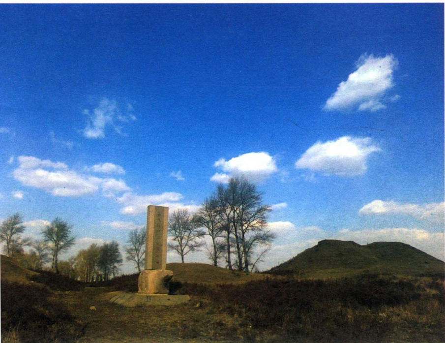
金上京会宁府遗址