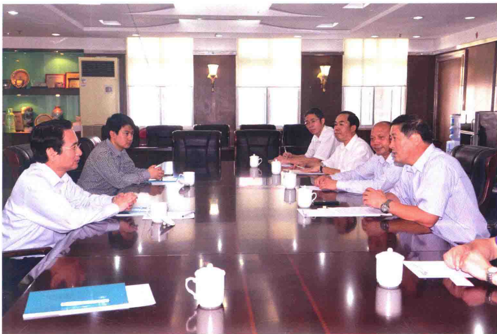
11月9日，国务院侨办副主任谭天星（左一）到学校视察指导工作，听取学校工作汇报，了解学校发展情况、参观学校图书馆，看望慰问学校离退休人员