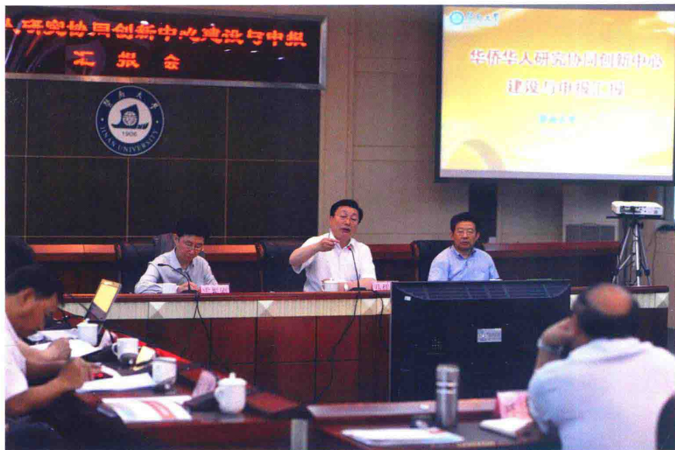
5月8日，华侨华人研究协同创新中心建设与申报汇报会在学校召开，国务院侨办副主任马儒沛（中）、人事司司长许玉明（右）、文化司司长雷振刚（左）及暨南大学、华侨大学校领导等与会