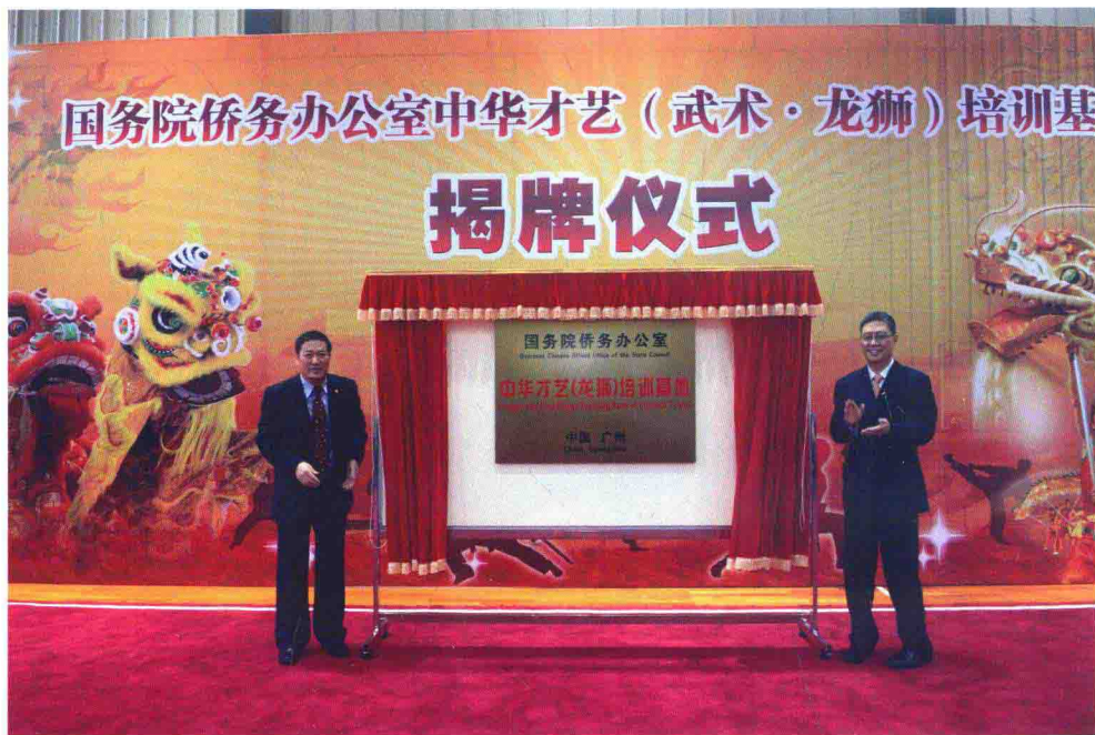
7月2日，国务院侨务办公室中华才艺（武术·龙狮）培训基地正式落户暨南大学，国务院侨办副主任何亚非(右)与校长胡军在仪式上为两个基地揭牌