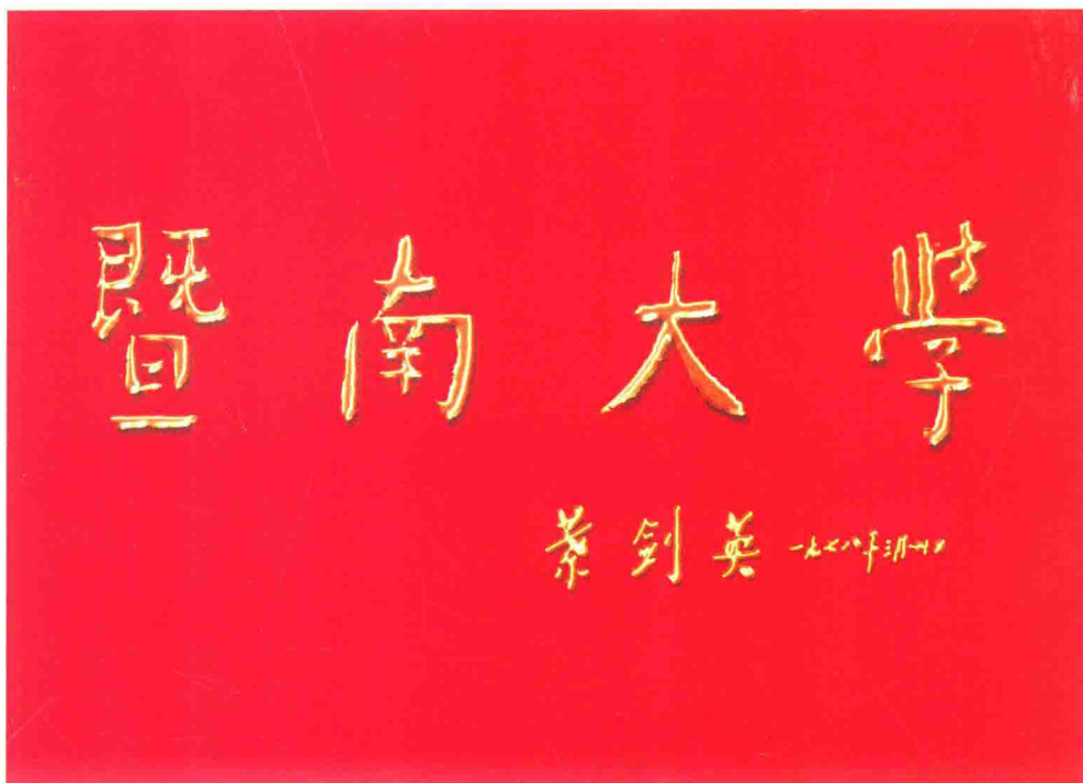
1978年叶剑英元帅为在广州复办的暨南大学题写的校名