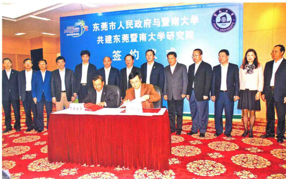
3月1日，学校与广东省东莞市政府共同组建的东莞暨南大学研究院签约仪式在东莞市举行。暨南大学校长胡军、东莞市委书记徐建华等市校领导出席仪式