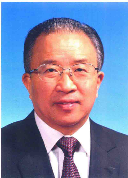
11月，暨南大学董事会顺利换届，原国务委员、中央外事工作领导小组办公室主任戴秉国担任暨南大学第七届董事会董事长