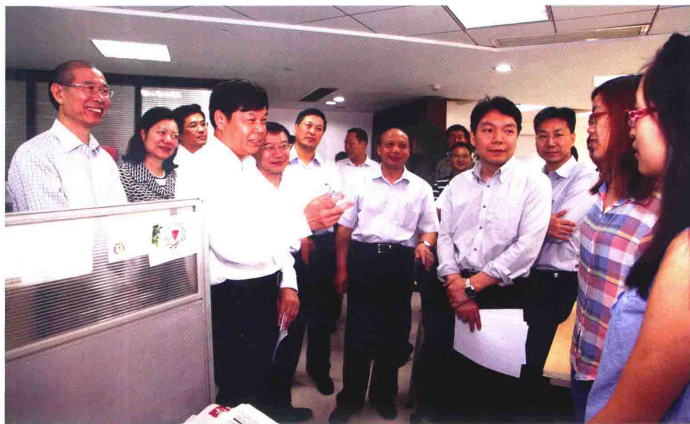
5月14日，教育部副部长杜占元（左二）到广州视察我校新闻与传播学院和南方日报等媒体共建的华南新闻传媒联合培养研究生示范基地。南方日报社社长张东明（左一）及广东省教育厅、学校领导陪同视察