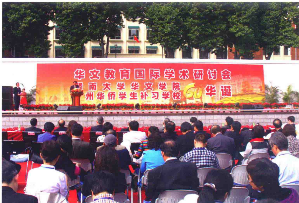
11月16日，暨南大学华文学院、广州华侨学生补习学校60周年华诞庆祝活动在广州举行，来自海内外的数千名学子、嘉宾、校友参加活动