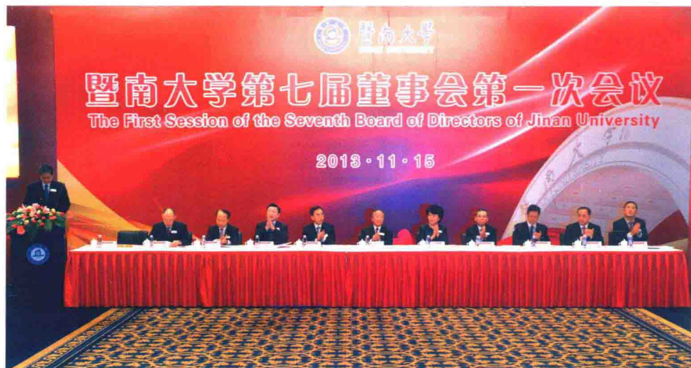
11月15日，暨南大学第七届董事会第一次会议在广州召开，暨南大学董事会董事长戴秉国、国务院侨办主任裘援平、广东省省长朱小丹、国务院侨办副主任马儒沛、广东省副省长陈云贤及海内外校董出席会议。图为大会会场