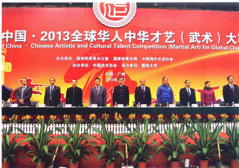
11月29—30日，2013全球华人中华才艺（武术）大赛在学校举行，来自美国、德国等五大洲18个国家和地区的21支队伍，共计200余人参加比赛