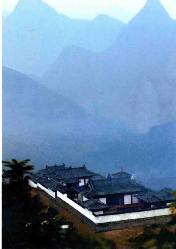
华荃山高登古刹（观音寺）