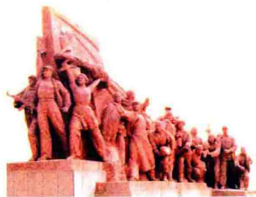
华蓥山游击队雕塑