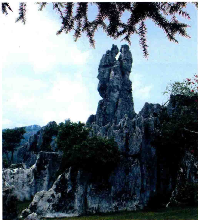
华蓥山七十二怪之「千年一吻」