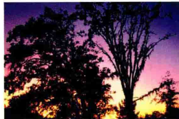
华蓥山风光之“日落”