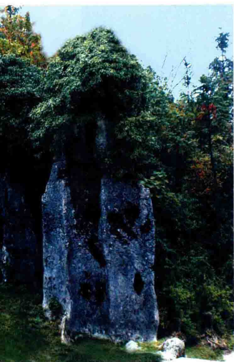
华蓥山七十二怪之「妙笔生花」