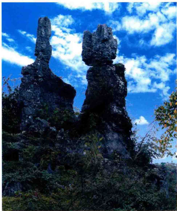
华蓥山七十二怪之“夫妻石”