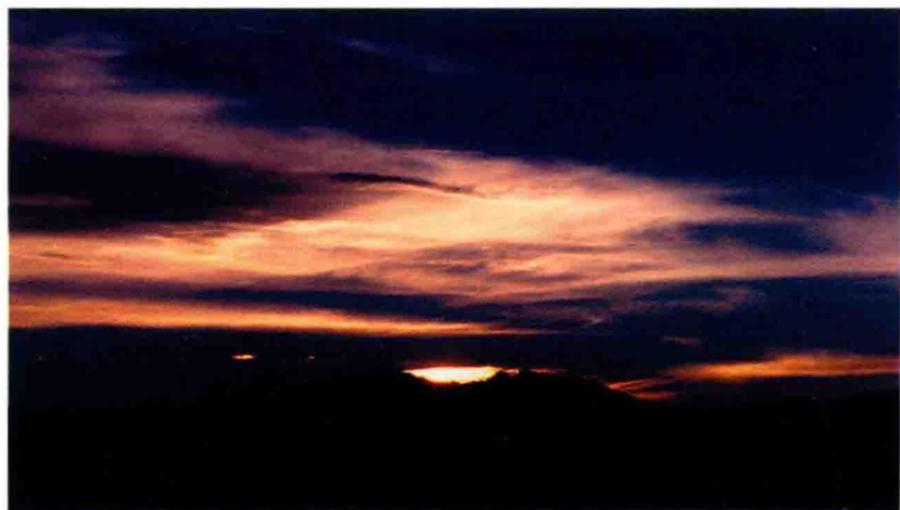
华荃山风光之“日出”