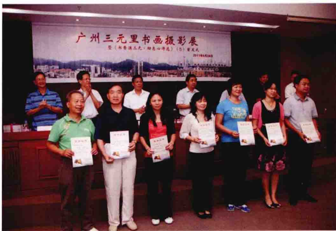
在《书香满三元 励志心得选》<5>首发式上，为入选作品作者代表颁发证书。