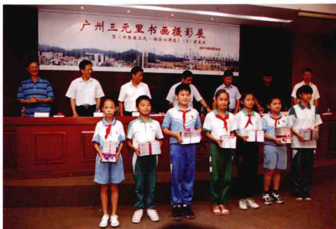
在《书香满三元 励志心得选》<5>首发式上向各校学生代表发书。