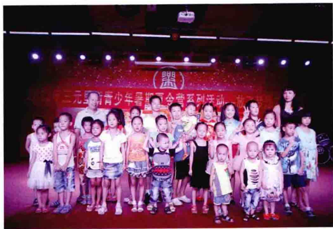
街关工委领导与青少年在“放飞梦想”才艺展后合影。