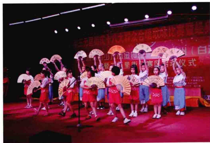
在2013年三元里街庆十八大群众歌咏比赛暨经典美文诵读活动中，三元里小学队的精彩表演。