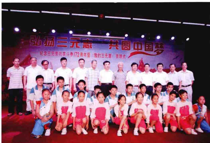
在纪念抗英斗争172周年现场会上，区、街、三元里村领导与青少年合影。