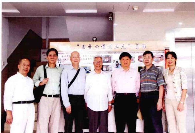
2012年10月区青少年读书活动现场会在我街召开。市、区和街关工委领导合影。