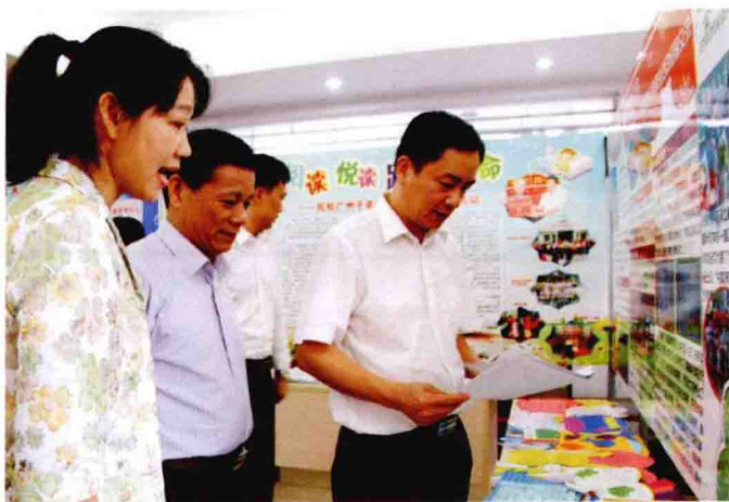
区、街领导认真观看学生开展读书活动的成果展。