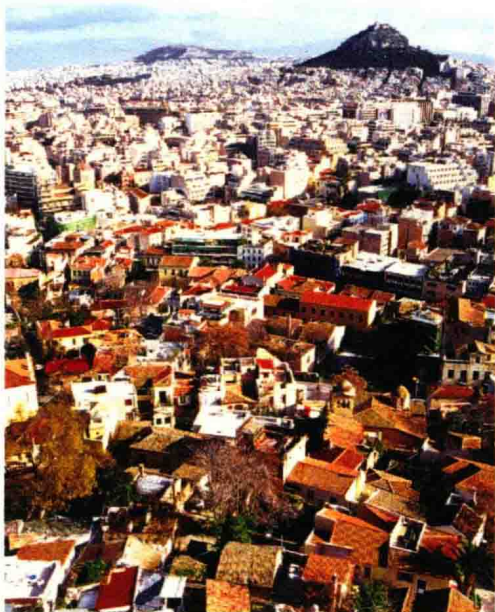
雅典卫城具有古希腊战时市民避难的功能，是由坚固的防护墙壁拱卫着的城市

造的建筑艺术结晶。雅典娜胜利女神庙，前后有4根爱奥尼亚式列柱，内有1尊没有翅膀的雅典娜神像。据说在争战中力求胜利的雅典人，故意将胜利女神翅膀切下，希望留住胜利的荣光。