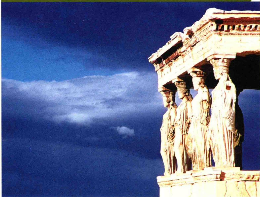
厄瑞克提翁神庙的南立面的西端，突出一个小型柱廊，用女性雕像作为承重柱

卫城雄踞于雅典市中心一座高 150 多米的四面陡峭的山丘上，从不同的角度都可以瞻仰它的雄姿。19 世纪，考古学家们在这里发现了许多古代遗址，包括道路、水井、墓穴和住宅，证明此处于公元前 2800 年便有人居住。