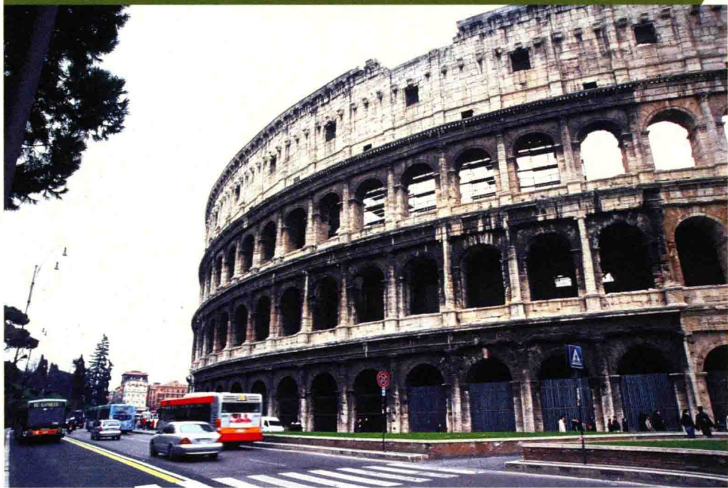
古罗马斗兽场是古罗马帝国专供奴隶主、贵族和自由民观看斗兽或奴隶角斗的地方

古罗马斗兽场从外观上看呈正圆形，俯瞰呈椭圆形，占地面积约 2 万平方米，大直径为 188 米，小直径为 156 米，圆周长 527 米，围墙高 57 米，可以容纳观众 8.7 万人。围墙共分四层，前三层均有半露柱式装饰，每两根半露圆柱之间有一长方形拱门，三层共计 80 个拱门，每个拱门相连一个通道。第四层装饰