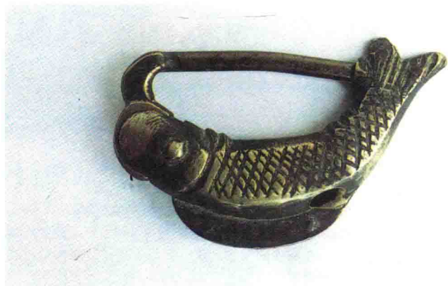
民国鱼形铜锁，鱼口衔锁柄，另一端与鱼尾相连，构思巧妙，形态生动。鱼昼夜时睁眼，锁用鱼形，更取象征意义。

第五是“技以载道”，它的意思是技术包含着思想的因素，道器并举，把形而下的制造如具体功能操作、技术劳动和形而上的理论结合起来。这种观念从先秦时候就开始形成了，其中道家思想