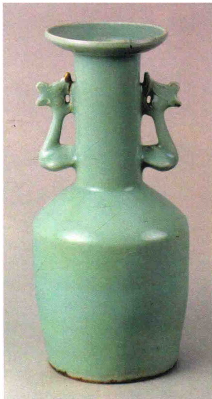
南宋龙泉窑青瓷双耳瓶，釉色温润，饱含中国传统文人化的含蓄典雅之美。

“工艺美术”不是一般的人工制造物。尤其是中国的“工艺美术”，它是亚洲这个独特文化区在地理上的标本（活的、生活的），它是中国独特生活方式的“原型”所在，它复杂地折射了土地、人、生产之间的关系，并通过“馈赠”和流转，在纵向的历史和横向的生活片断中传承。也正是由于这个原因，“工艺美术”不死，它会与中国人如影相随。