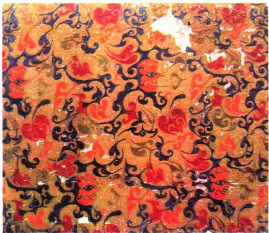
汉代黄绮地乘云绣。汉代以来，中国丝绸通过丝绸之路不断西进，饮誉世界。

中国大陆拥有绵长的海岸线，但它的文明发源地——中原，却是深入内陆。夏、商、西周这三个中国最早的国家行政体的出现，都是在内陆。对于在平原和山区成长起来的民族，土地的耕作是他们最重要的生存方式。中国传