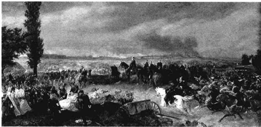
普奥战争之萨多瓦会战

就在普军即将战败的危急关头，一直与毛奇在一起的普鲁士首相奥托·冯·俾斯麦（Otto von Bismarck）突然发现：在战场东面几公里外，有一行类似树木一样的东西在移动。毛奇拿起望远镜观察片刻，然后对身边御驾亲征的国王威廉一世兴奋地说：“陛下不但赢得了这场战役，而且也赢得了战争。”原来就在普鲁士易北军团和第一军团陷入与奥军苦战的同时，一名传令兵奔驰了 30 多公里，给王储送去了国王的强制性命令，第二军团随即开始向北运动，这就是俾斯麦看见的“移动的树木”。下午 2 时 30 分，第二军团向奥军北面的防区实施攻击。奥军防线瓦解。贝纳德克元帅于下午 3 时下令全线撤退。但是普军攻势非常猛烈，奥军第一军只能发动骑兵反攻，以支持炮兵及掩护友邻部队撤退。这次行动在 20 分钟之内就