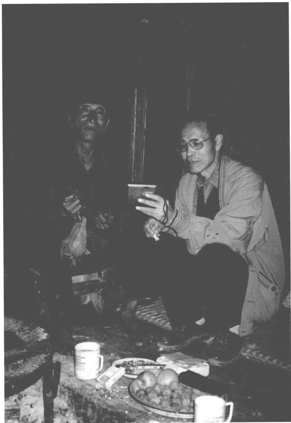
1994年11月，在云南向普米族艺人采录《格萨尔》。