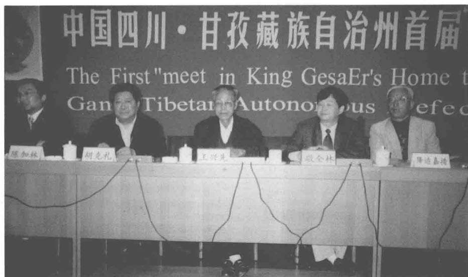
在四川成都参加《格萨尔》学术会议