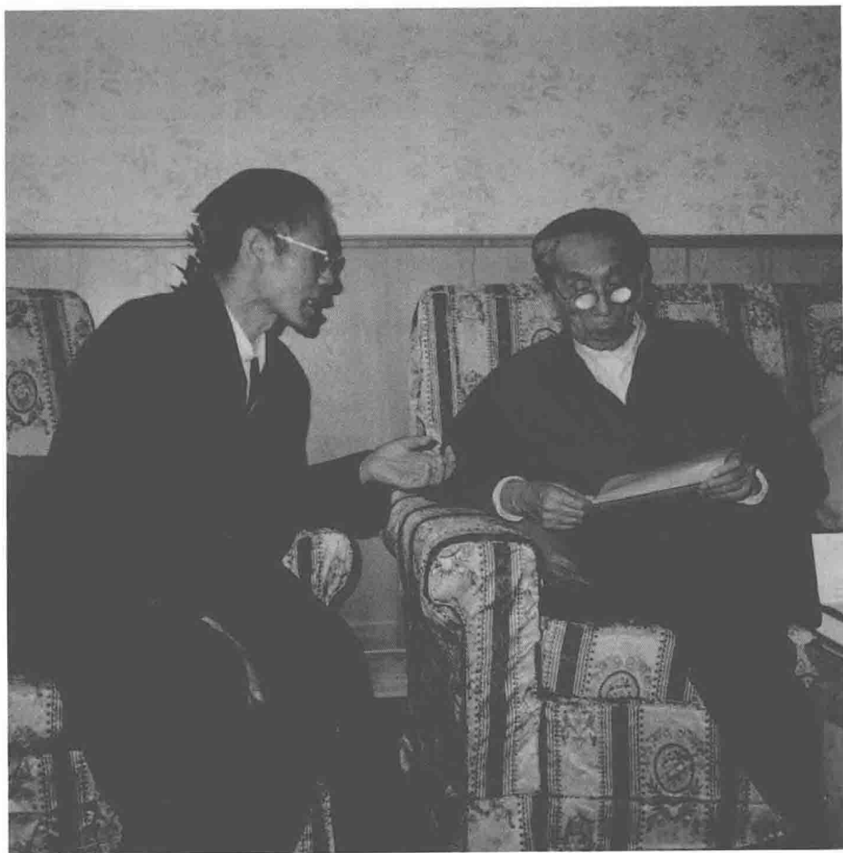
1999年5月，全国政协副主席阿沛·阿旺晋美同志听取王先生关于《格萨尔》文库编纂工作情况的汇报。