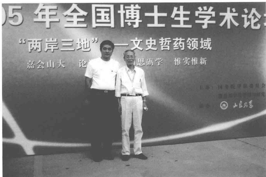
2005 年在全国博士生学术论坛上