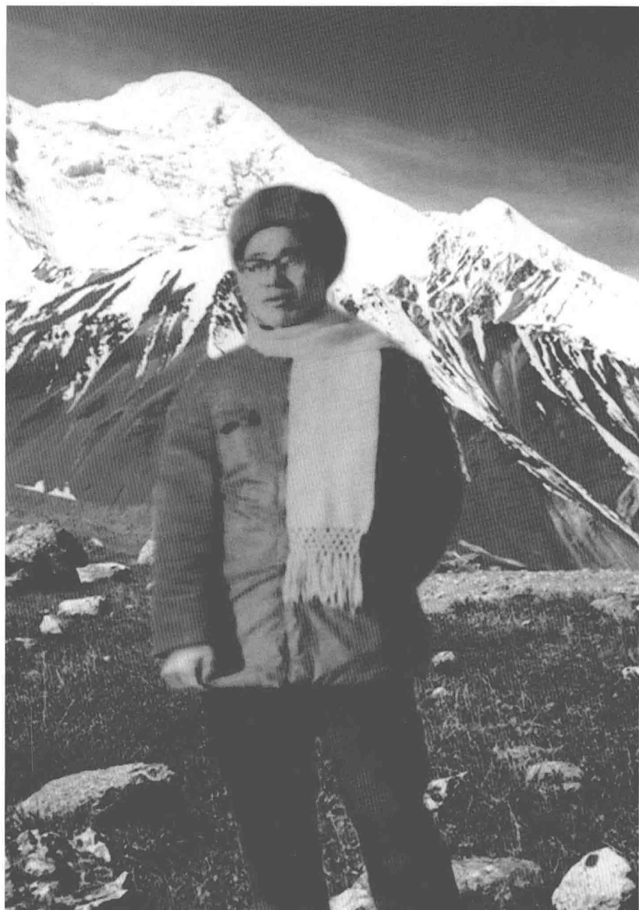
1960年代在西藏阿里工作