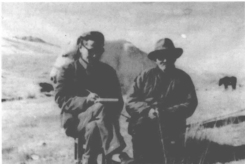
1980年代在甘肃省肃南县向裕固族艺人调查《格萨尔》