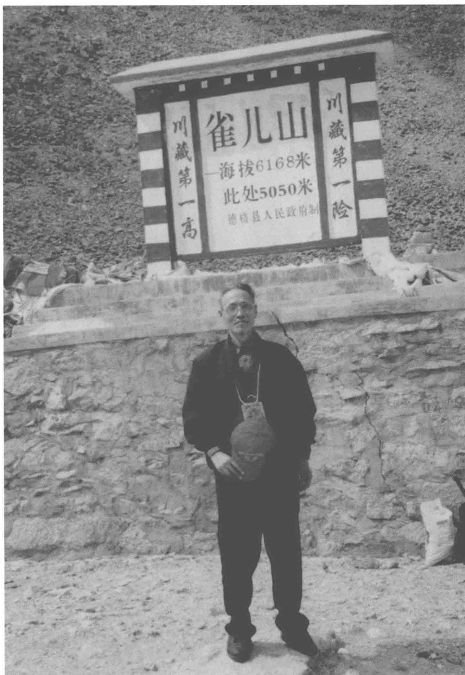
赴德格县调查途中