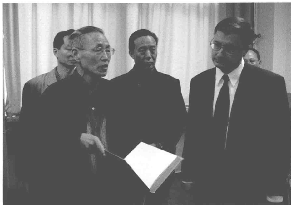
王先生向美国学者介绍《格萨尔文库》