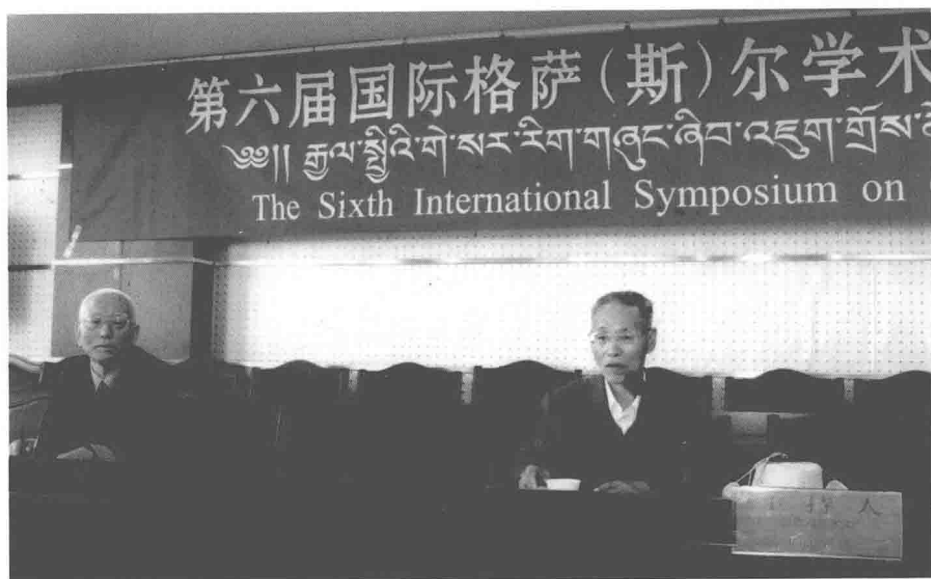
2006 年在甘肃省玛曲县主持第六届国际《格萨(斯)尔》学术研讨会