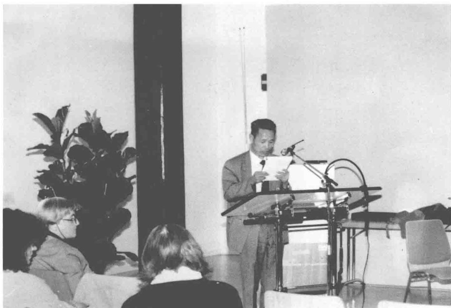
1995年在维也纳国际藏学会上