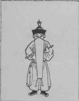
正立。于正 舉。戚衡左 手上。