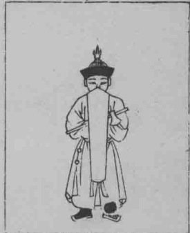
正立。于正 舉。戚衡左 手上。