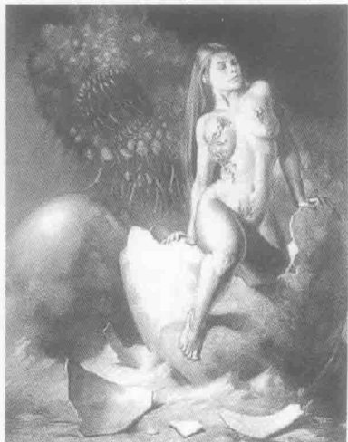
从这里诞生了引起特洛伊之战的祸根——美人海伦

向清军倒戈，导致满族人主中原。“恸哭六军俱缟素，冲冠一怒为红颜。”性事，确实可以引起战祸，也可能导致亡国！伊拉克被炸，只是受一宗性事的波及而已。这余波随后又扩展到了科索沃——谁能排除北约盟军的决策中没有克林顿个人因素，当他特别需要重塑形象的时候？