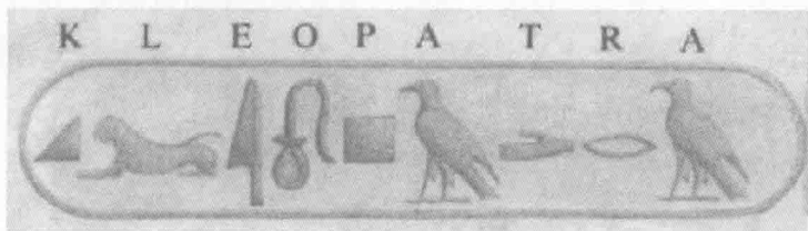
克丽奥佩特拉的象形字名讳

埃及托勒密王朝的末代女王克丽奥佩特拉（Kleopatra，前 69 年—前 30 年）是国王托勒密十二世（Ptolemy XII）的幼女，自称为太阳神的女儿，天生貌美，受过良好教育，会多种语言，极富智慧与才干，可以说上天把一切美好的东西都给予了她。公元前 51 年，父王死后即位，与其弟（也是她的丈夫）托勒密十三世共同执政于埃及。