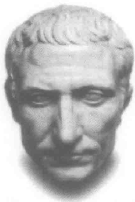
有色魔之称的凯撒

回合，便拜倒在石榴裙下，彼此立刻爱得死去活来。公元前 37 年他们终于在埃及宣告结婚。