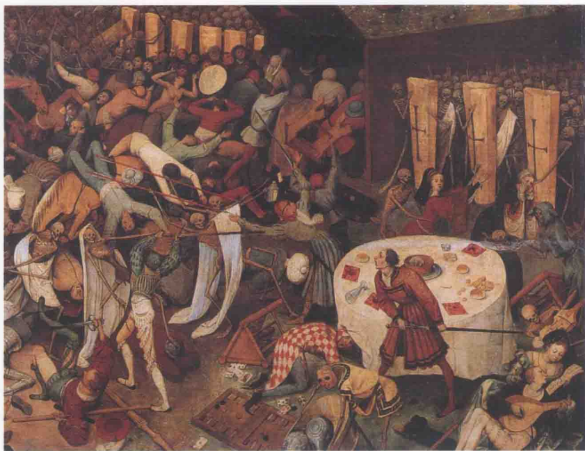
老彼得·布吕赫尔《死神的胜利》 (局部) 约 1562

办了一场拍卖会，出售刚被处决的英王查理一世的收藏，腓力四世买到了曼特尼亚的《圣母的葬礼》、拉斐尔的《圣家族》、丢勒的《自画像》以及提香、委罗内塞和丁托列托的作品。他还将西班牙文化黄金时代最伟大的画家迭戈·委拉斯开兹邀请入宫，所以现在的普拉多博物馆保存着这位画家的大部分油画，其中包括一系列宫廷肖像画和《布列达的投降》《宫娥》《阿剌克涅的寓言》等杰作。为了增加皇室的收藏，腓力四世曾两度派遣委拉斯开兹前往直意大利购买画作和雕塑，买来的作品包括委罗内塞的《维纳斯与阿多尼斯》和丁托列托取材于《旧约全书》的几幅画作。1639年，腓力四世收获了提香的《酒神的狂欢》和《维纳斯的礼赞》，之后还得到瑞典女王克里斯蒂娜赠送的丢勒的板面油画《亚当和夏娃》。另外，把阿卡萨（古老王宫）的绘画、雕塑、器皿和家具归于皇家收藏也是腓力四世的主意，这样就能避免作品分散了。在腓力四世统治时期，西班牙在经济和政治上已经不可避免地走向衰落。他的继承人卡洛斯二世（1665—1700）无法担当国家重任，所幸的是，由于法律约束，这笔艺术财富却保存了下来。他的妻子，诺伊堡的玛利亚·安娜，企图将画作进行国际交易兑换成货币，但在卡洛斯二世去世之后，众多作品当中的 5539 幅绘画杰作被收藏进美术馆里，幸免于难。除此之外，面向所有王室居所的艺术品管制也要归功于卡洛斯二世。