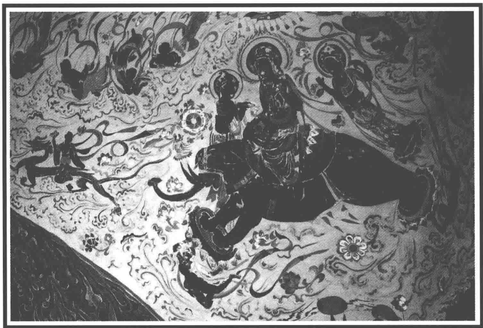
佛乘象入胎古壁畫·敦煌莫高窟(初唐)·