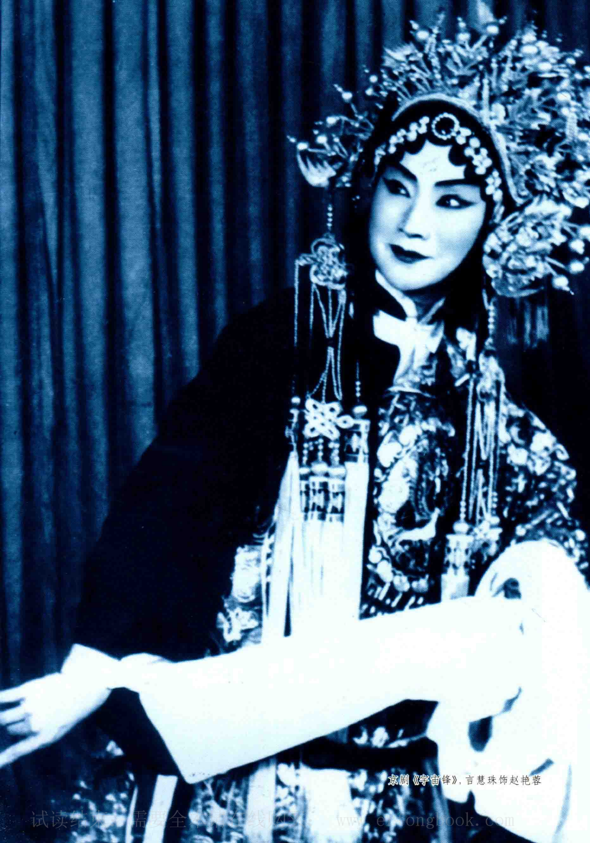
京剧《宇宙锋》，言慧珠饰赵艳蓉