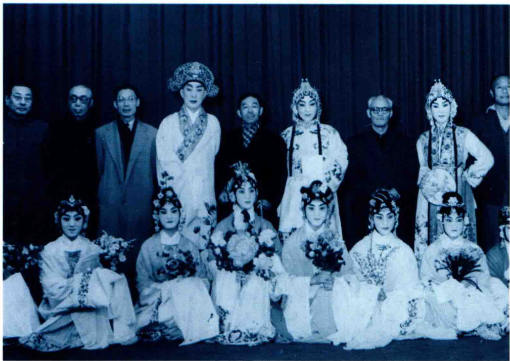
梅兰芳(左六)、俞振飞(左四)、言慧珠(左八)合演《游园惊梦》后，与沈雁冰(左五)、夏衍(左三)、田汉(左二)等合影(1960年)