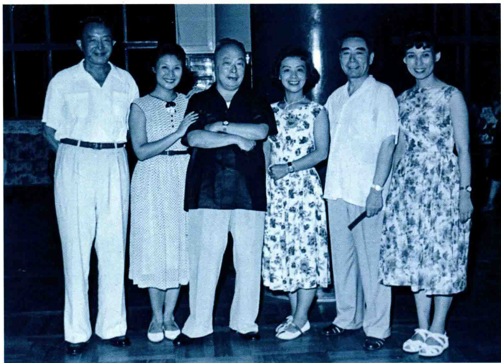
1960年，上海京剧界的三位主要女演员与中央领导合影。左起：罗瑞卿、言慧珠、陈毅、李玉茹、周恩来、童芷苓