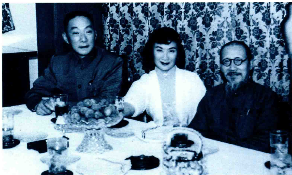
俞振飞（左）、言慧珠和著名书法家马公愚（右）