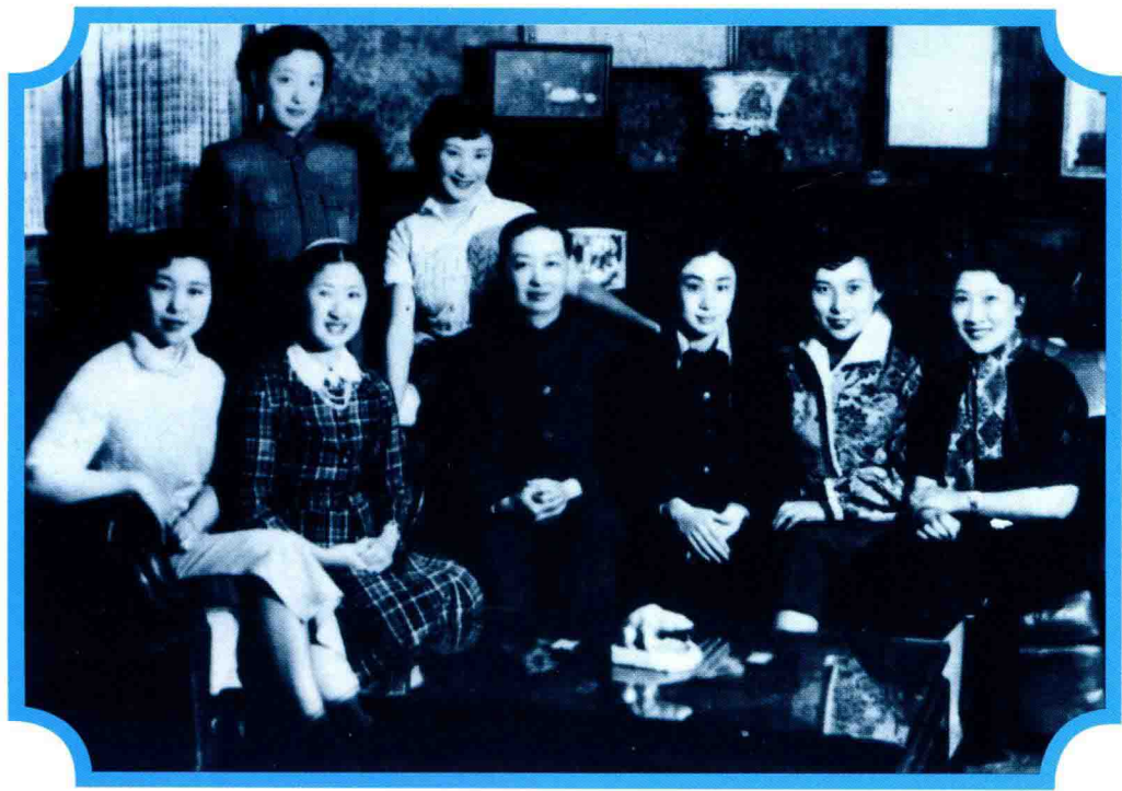
梅兰芳和弟子们在一起。前排左起：顾景梅、沈小梅、梅兰芳、陈正薇、童芷苓、王熙春；后排左起：梅葆玥、言慧珠