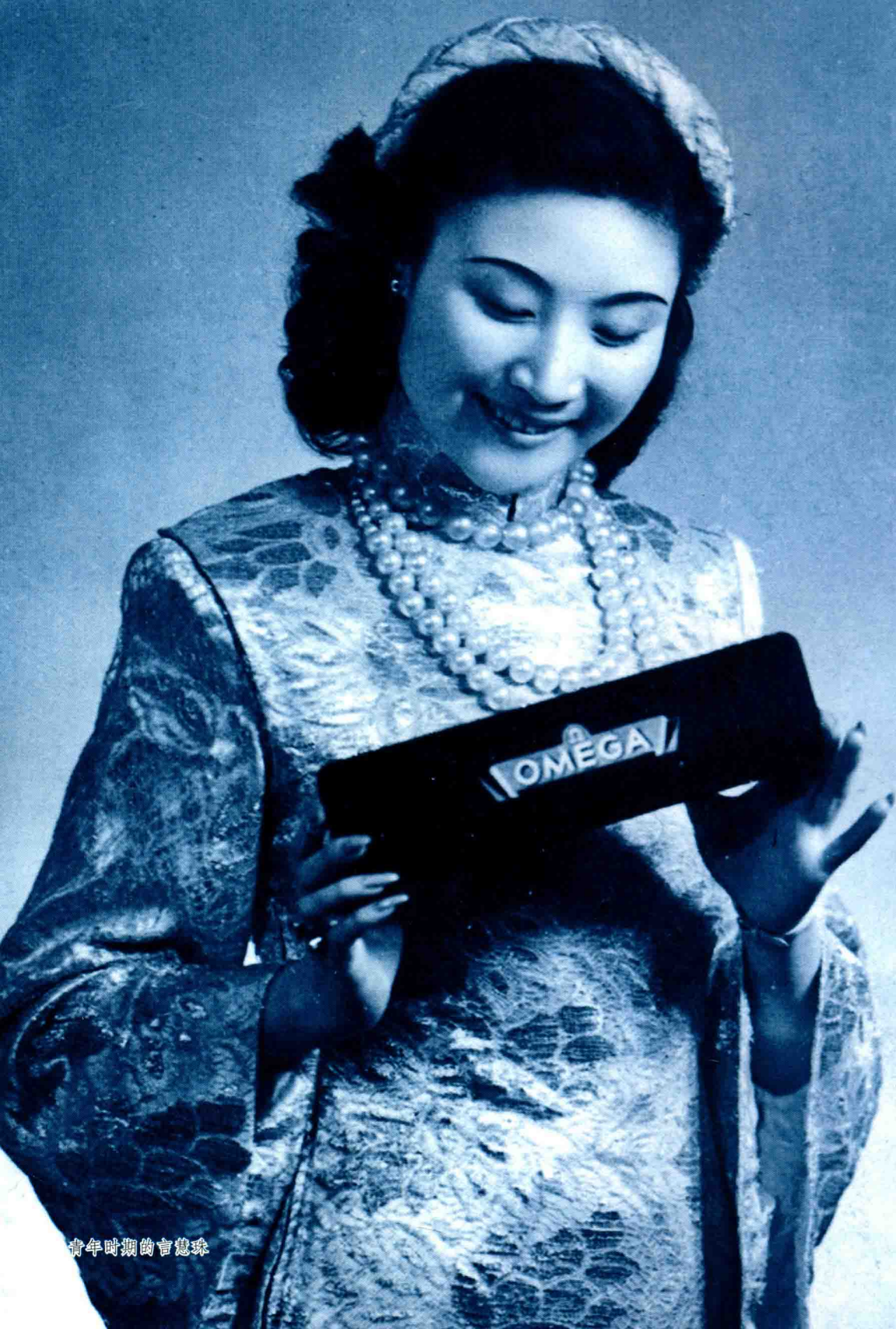
青年时期的言慧珠