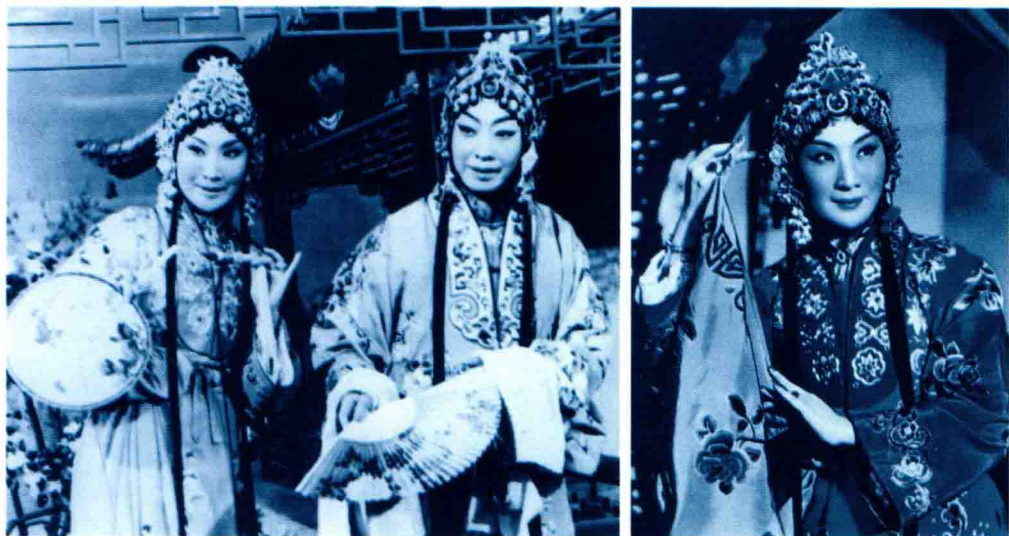
电影《游园惊梦》，梅兰芳饰杜丽娘，言慧珠饰春香