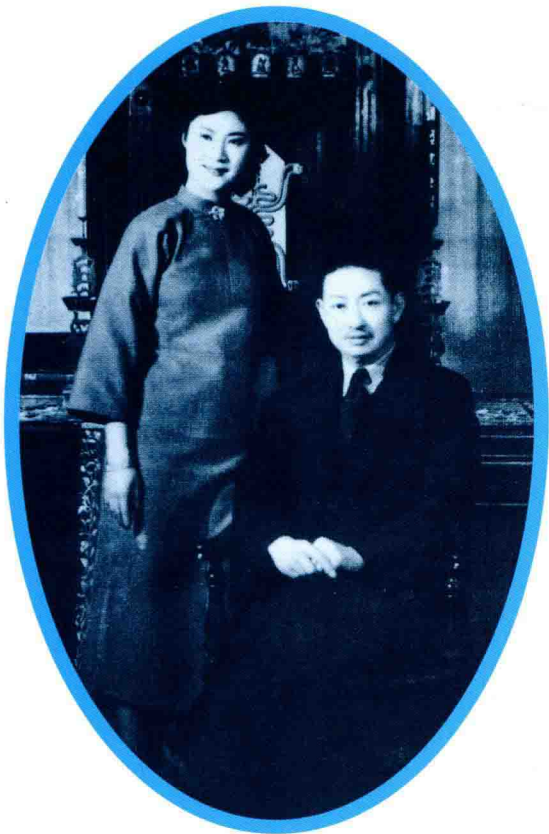
言慧珠和老师梅兰芳