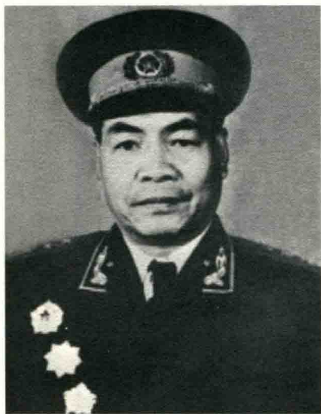
1955年被授予上将军衔的张宗逊

朱德同志指挥红三十一团第一营和红二十九团在新七溪岭阻击敌人，令红二十八团从老七溪岭向龙源口迂回，抄新七溪岭敌人的后路。我带领永新县游击大队连夜赶往龙源口，配合主力行动。