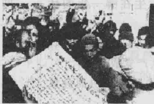
《中华人民共和国土地改革法》的颁布