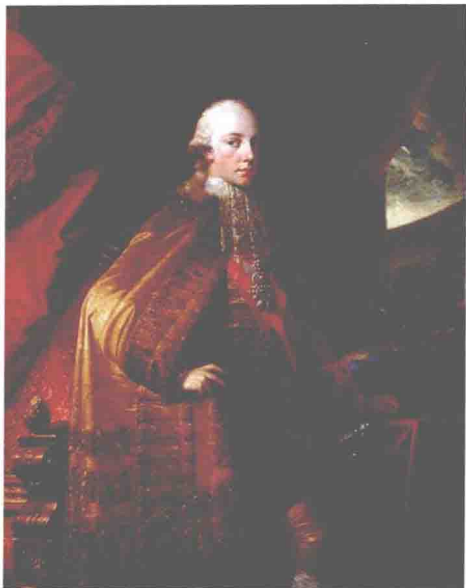
◎ 1792年，年仅25岁的弗朗茨二世

内因则是法兰西共和国的不理智和盲动。比如早在1791年8月27日，奥地利与普鲁士曾发表皮尔尼茨联合宣言，他们要求法国解散立法议会，恢复国王王位，并邀请欧洲各国参与。不过这只是宣言，并不是开战。但1792年4月20日，法国立