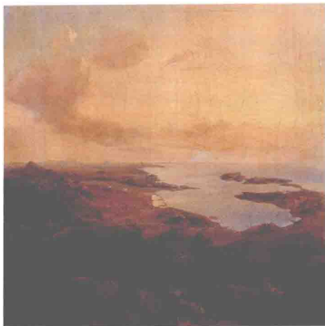
◎ 法军围攻土伦的油画

册《炮兵学笔记》。当时法军军官手册记述：“炮兵是一支‘完整’部队不可缺少的组成部分，没有炮兵参与的战斗是不切合实际的”。炮兵不但加强了一支军队的火力，而且在更远射程丰富了军队的火力手段，以至于步兵有时所能做的只是扩张炮兵的胜利战果。