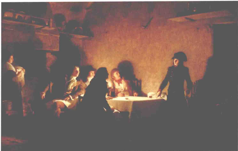
◎ 油画：1793年拿破仑在博盖尔进行晚餐

此时的拿破仑早已经放弃了狭隘的科西嘉爱国主义，并不惜为此与科西嘉独立领袖保利决裂，最后不得不举家逃离科西嘉岛。可以说，步入历史视野的拿破仑无论是法理上还是心理上都是一个不折不扣的法兰西共和国公民。