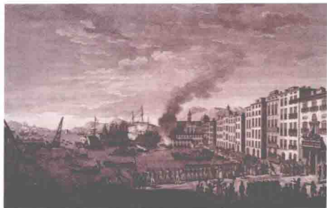
◎ 反法联军占领土伦

位于法国瓦尔省南部的土伦，是法国在地中海北岸的重要军港。法国地中海舰队主力就驻扎在此。1793年7月，土伦当地的官员发动了针对共和国的叛乱。到了8月，自认无法抵挡共和国军队的土伦叛军，把舰队、港口、军械库、城市及炮台一概放弃，更允许反法联军英国和西班牙舰队驶入土伦港，以换取其庇护。于是，8月28日，英国胡德海军上将和西班牙兰盖拉海军上将率领的联军进占了土伦。当时英国的登陆兵力是1626人，其中既有第十一北德文郡步兵团第1营、第三十剑桥郡步兵团第1营、第六十九南林肯郡步兵团第1