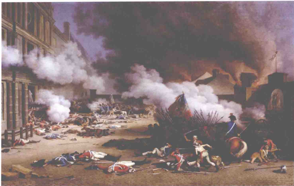
◎ 1792年8月10日，法国大革命中的革命武装攻击路易十六所在的杜伊勒里宫，与路易十六的瑞士禁军作战。当时拿破仑正在巴黎，他作为旁观者，目睹了这一切，还拯救了一名差点被屠杀的瑞士战俘