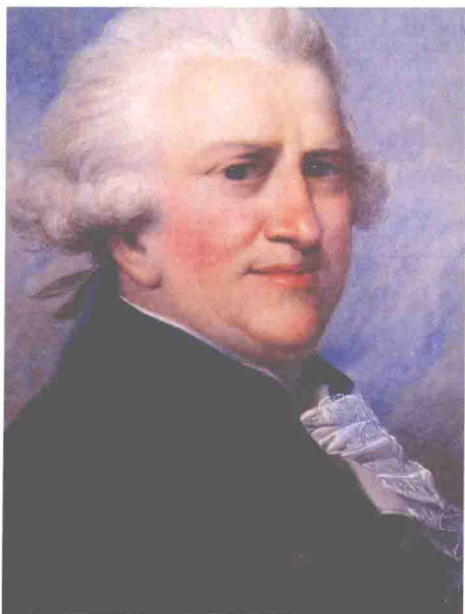
科西嘉独立领袖帕斯奎尔·保利

破仑的初战。1793年2月22日，拿破仑曾在一位年长的科西嘉上校希撒里的率领下，参与了法军对撒丁王国的跨海远征。拿破仑当时担任远征部队的副指挥官，指挥着他自己的科西嘉志愿营和远征部队的炮兵，计有一门6法寸臼炮和两门4磅炮。远征一开始进展顺利，结果法军却发生哗变，逼迫软弱无能的希撒里把部队撤回船上。也有一种说法，这次哗变是希撒里和保利的一次阴谋，打算将跟自己政见不合的拿破仑扔给敌人。总之，25日，远征部队开始毫无秩序地向船上撤退。拿破仑虽然在计划和指挥上没有任何责任，但他的初战就这么宣告失败，他的三门炮也不得不被扔在海滩上。由此可见，军事天才也不是一开始就无往不利的。