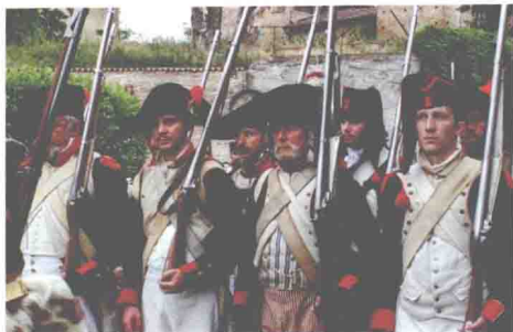
现代人复原的法国大革命军队

英军 2114 人、西班牙军队 6900 人、那不勒斯军队 4900 人、此外还有 1600 人的撒丁军队和 1600 名保王党。英国首相皮特还许诺，将有一个军的奥地利人外加几百名英军抵达土伦。甚至，善于算计的英国人已经开始计划着要求波旁王朝割让科西嘉岛或西印度群岛的某些岛屿作为战费赔偿了。