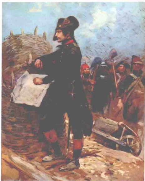
◎ 修筑炮垒的拿破仑，他身后那名士兵身穿的是典型的工兵铠甲

那个炮垒被设在奥利乌尔隘路口附近，那儿地势不是很高略偏公路右边。可是它距离海岸竟然有4公里之远。这个距离正好是24磅攻城炮有效射程的两倍，而英舰的停泊处距离海岸还有800米。也就是说，卡尔托实际上命令拿破仑去轰击远在大炮2.5倍有效射程之外的敌舰。