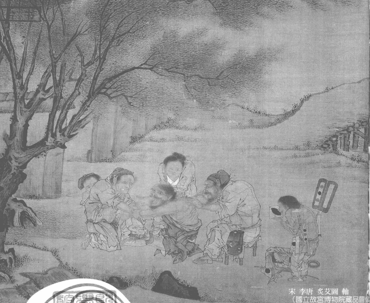
宋 李唐 灸艾圖 軸