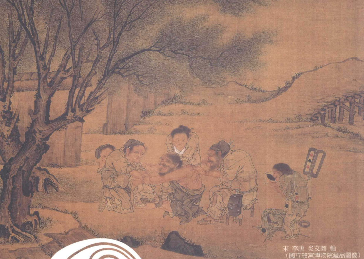
宋 李唐 灸艾圖 軸 (國立故宮博物院藏品圖像)