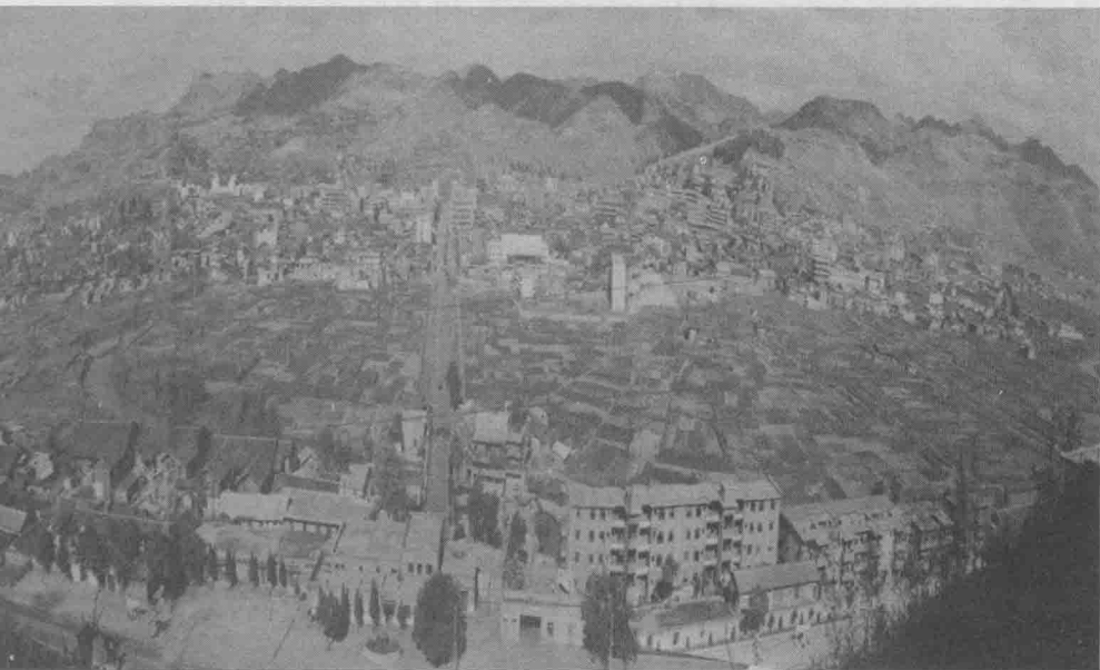
桐梓县城全景（20世纪90年代初）

三五成群的小学生们每天上学放学时走过这条叫做“世杰”的小巷，偶尔也会露出好奇。小巷为何叫“世杰”？“世杰”又