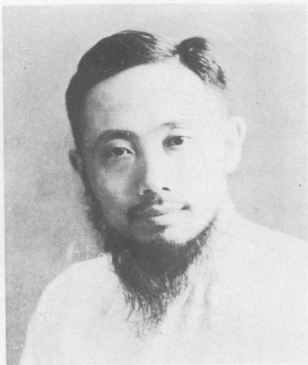
李公樸，著名的教育家和出版家。抗戰勝利後，由於反對內戰，結果死於無聲槍下。