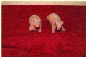
江门市郊浮头乡出土的东汉陶猪