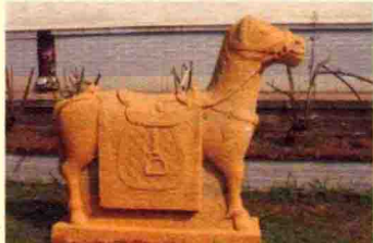
江门市郊杜阮长乔村出土的明代石马

土著居民： 远在新石器时代，五邑地区就有人类活动的痕迹。从新会城郊的罗山咀贝丘遗址，台山广海、赤溪、深井等地的沙丘遗址、山岗遗址，以及开平苍城、赤水，鹤山陈岗、罗纱岭，恩平那吉、洪窖、大田等地发现的数十处古人类活动遗址中，考古人员挖掘到了磨制的石斧、石刀、石锤、石凿、石网坠等石器工具，印有粗纹的陶罐、陶碗、陶纺锤，以及用鱼骨、兽骨制成的骨针、骨饰物等，这说明在4000—5000年前的新石器