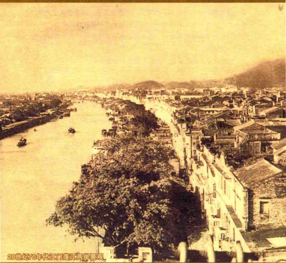
20世纪70年代江门蓬江两岸景观