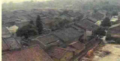
鹤城田心村客家民居

初年，纯客住县集中分布在闽、粤、赣三省交界地区。如广东南雄、梅县、五华、大埔等等。客家人进入五邑地区可以追溯到明代。明朝从南雄珠玑巷迁来五邑建村的移民基本都是客家人。但客家人大规模来五邑