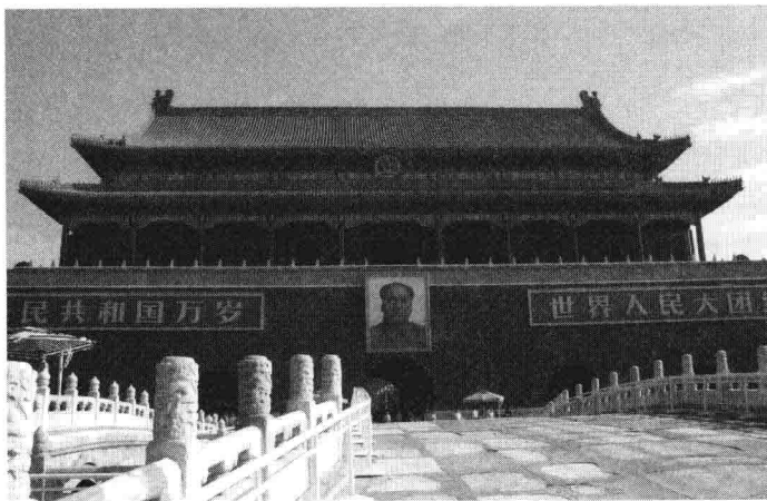
图 1-1 天安门