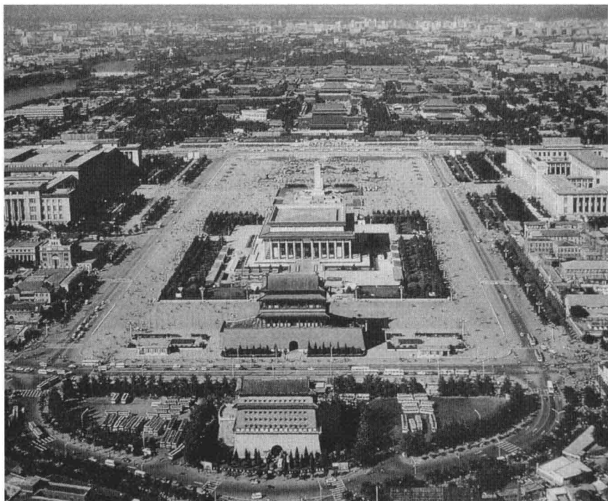
图 0-1 现代天安门体系—古代皇城体系