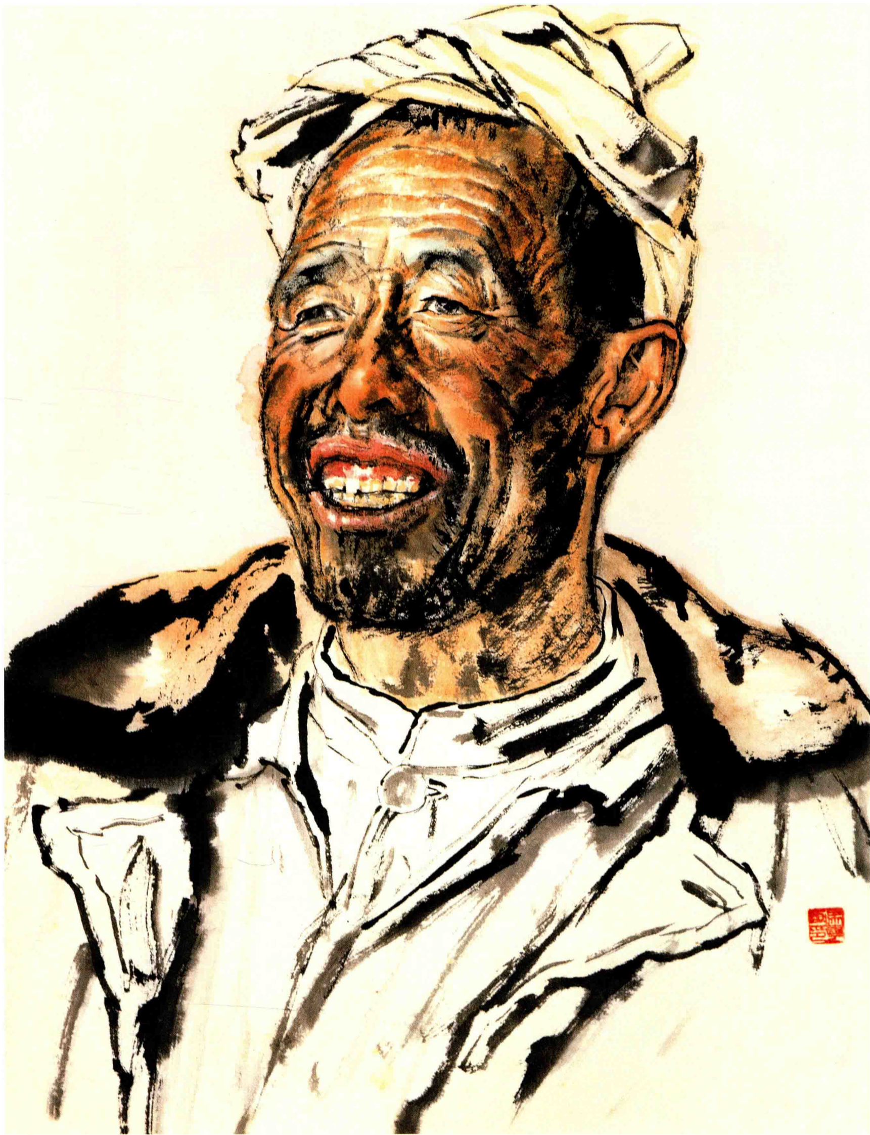
◇ 陕北农民 1980年 纸本