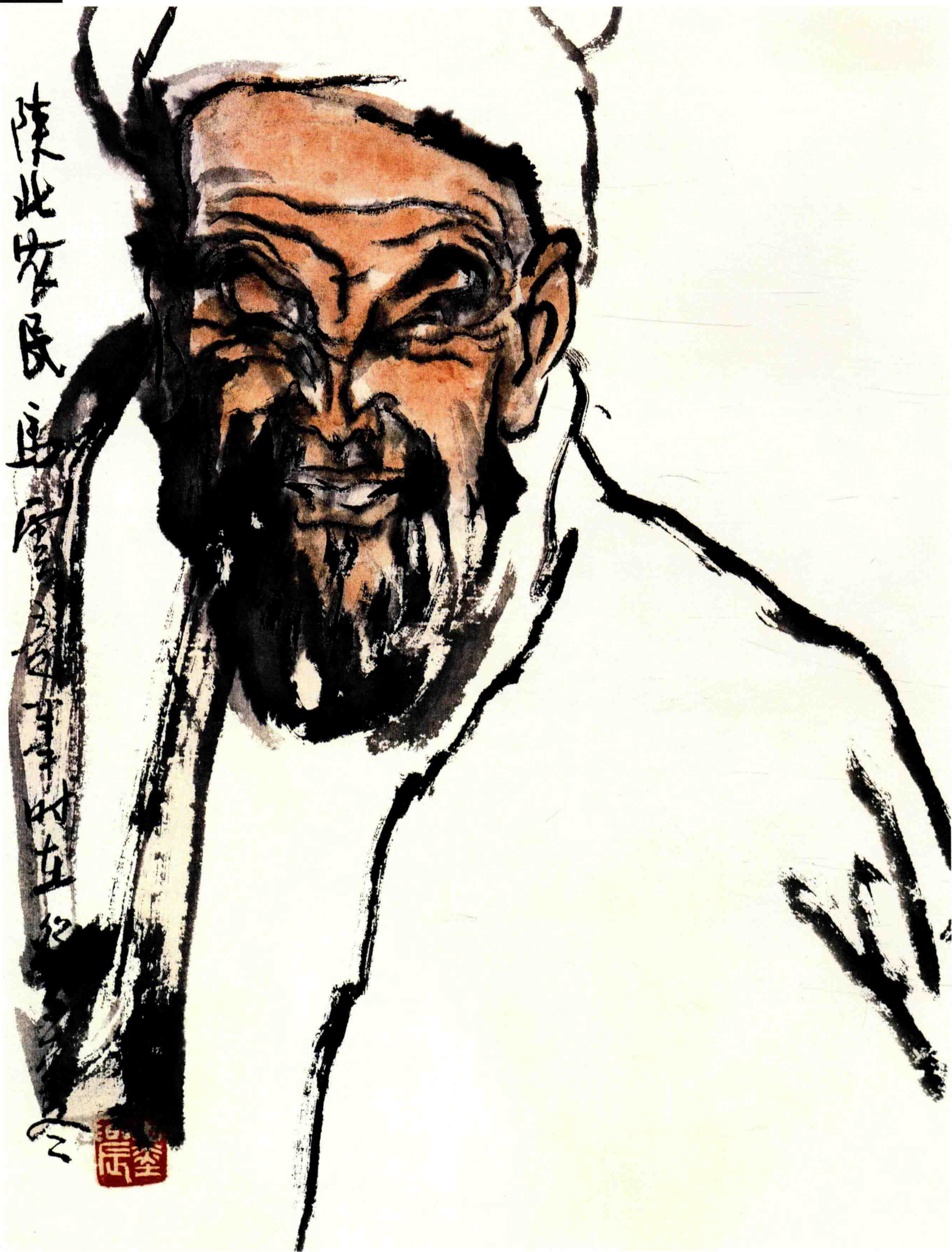
◇ 陕北农民 1983年 纸本