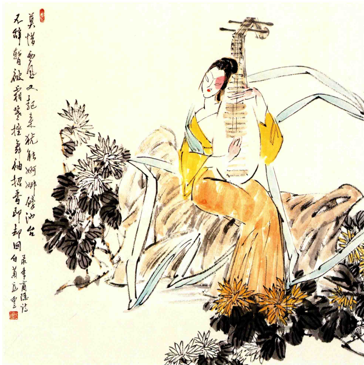
◇ 乐女之二 2004年 纸本