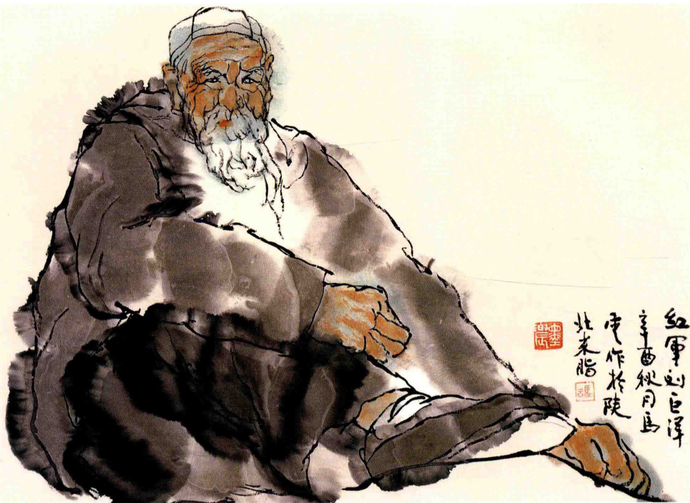
◇ 红军刘巨洋 1981年 纸本