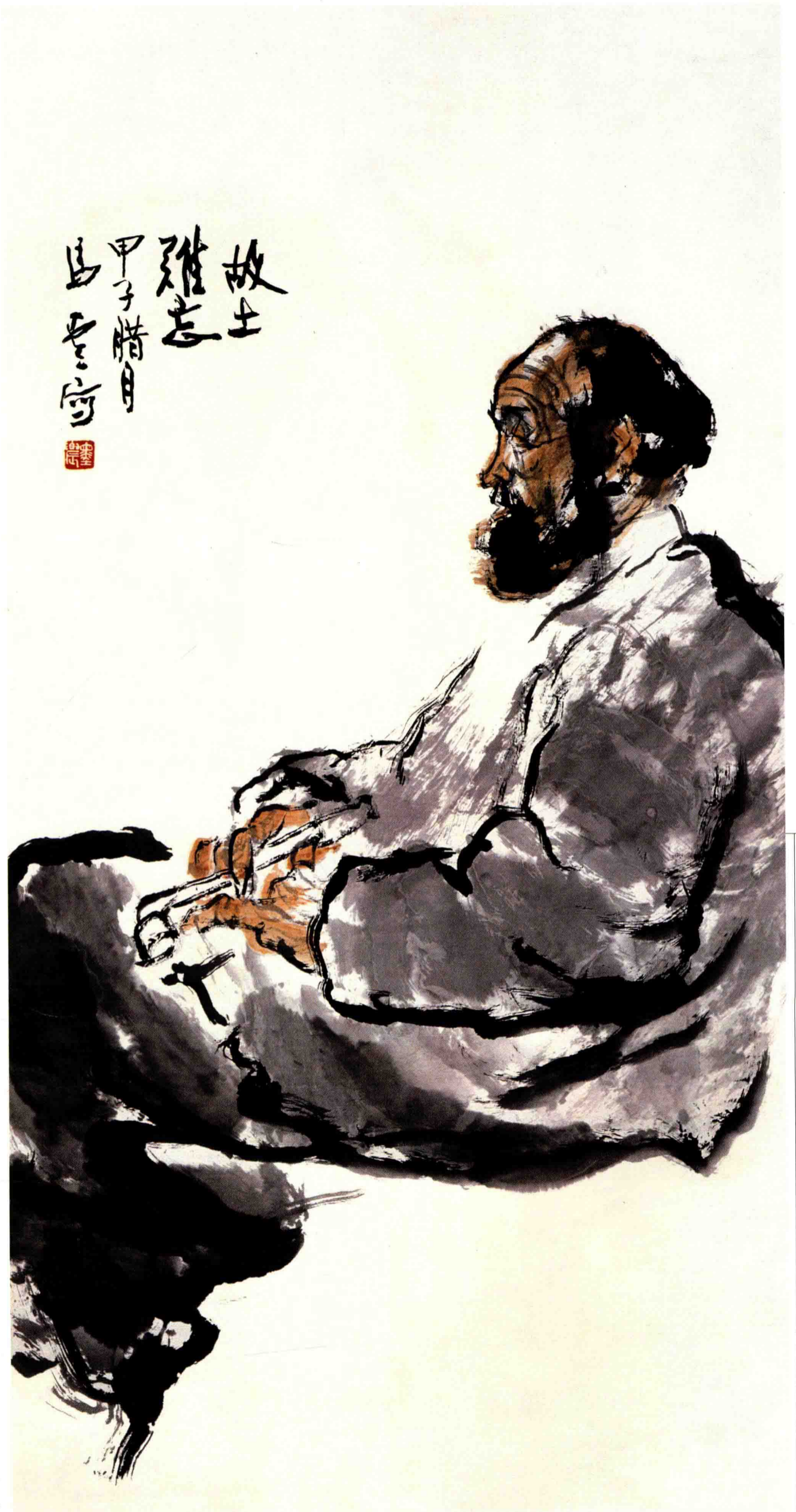
◇ 故土难忘 1984年 纸本