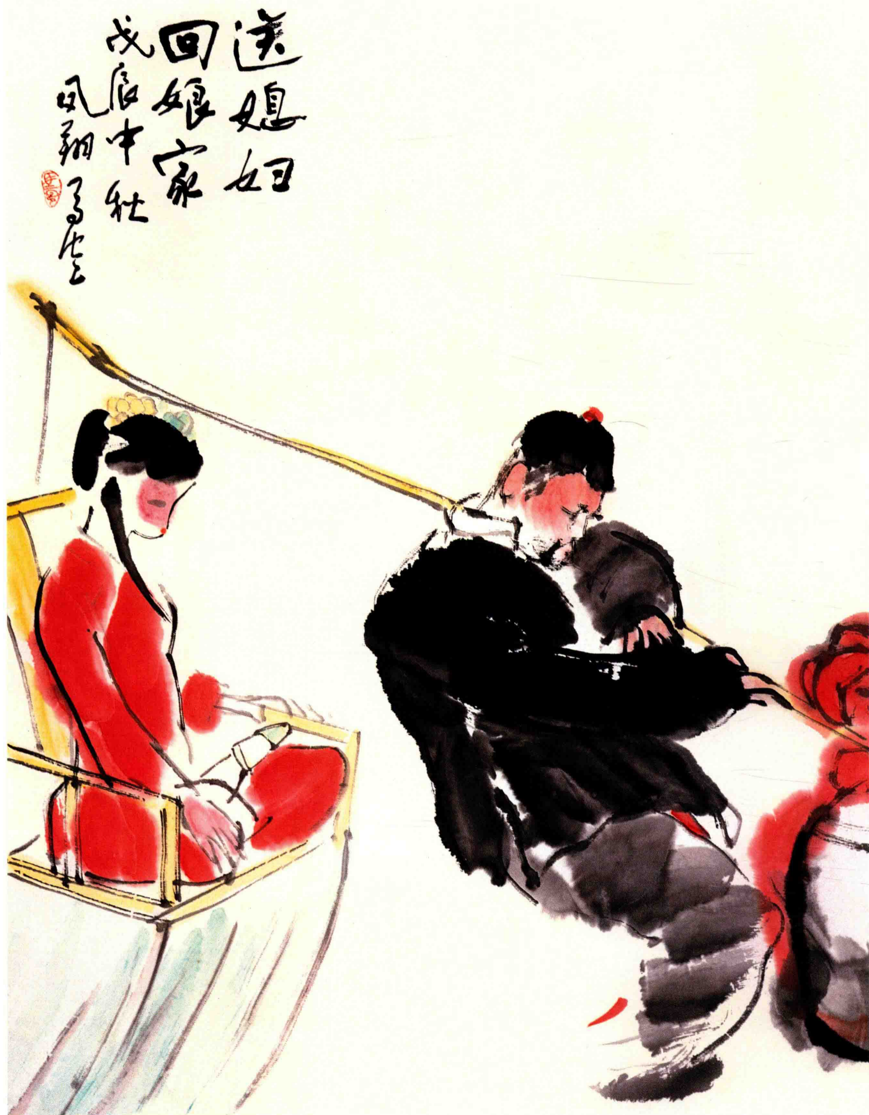
◇ 送媳妇回娘家 1988年 纸本