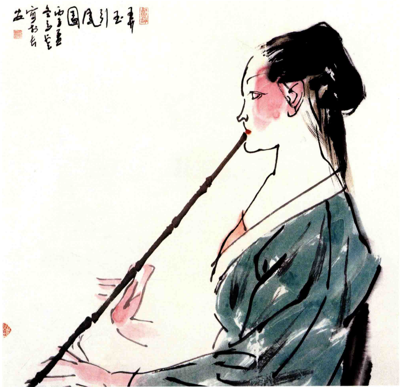
◇ 弄玉 1996年 纸本