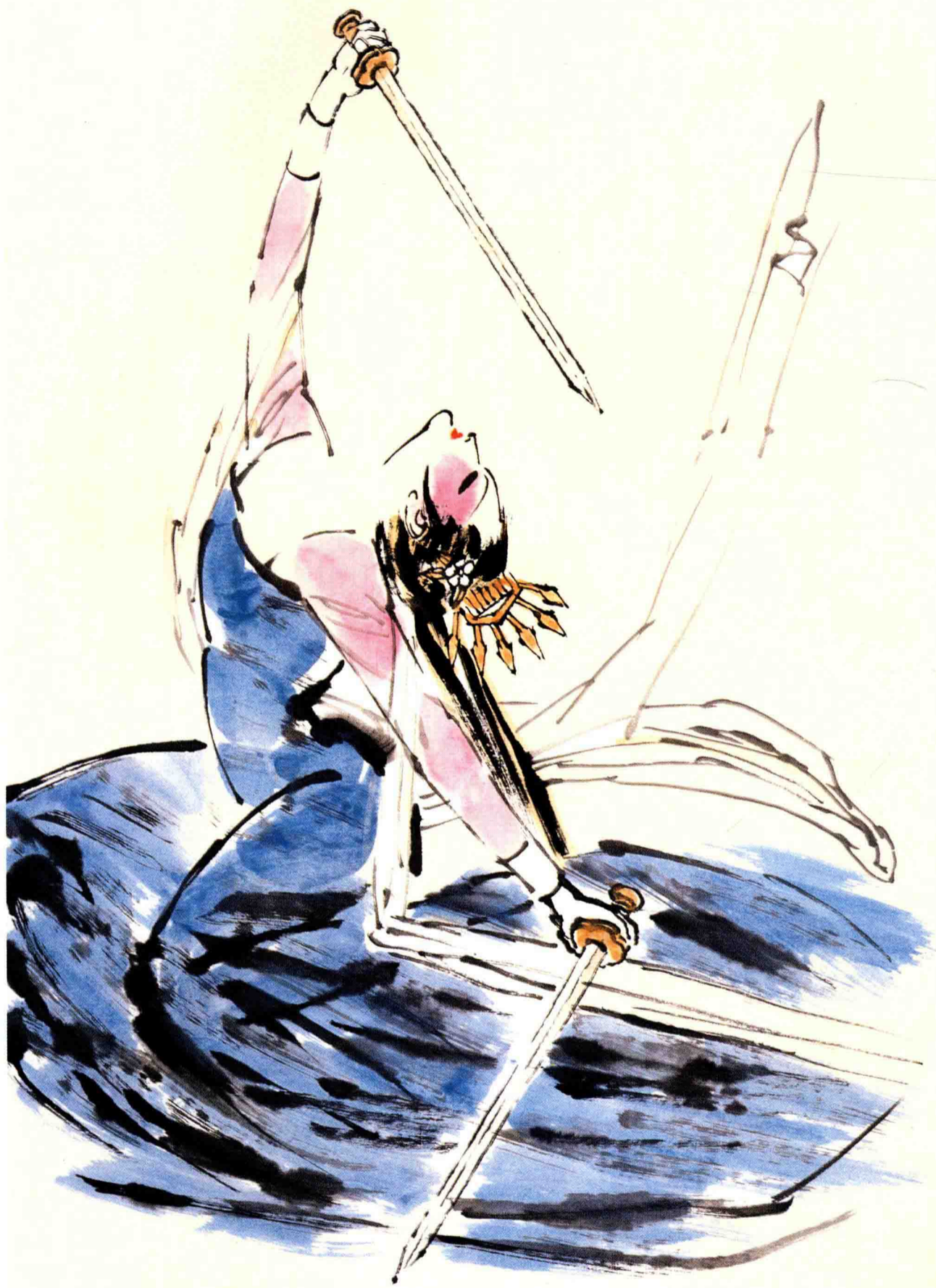
◇ 公孙大娘 1999年 纸本