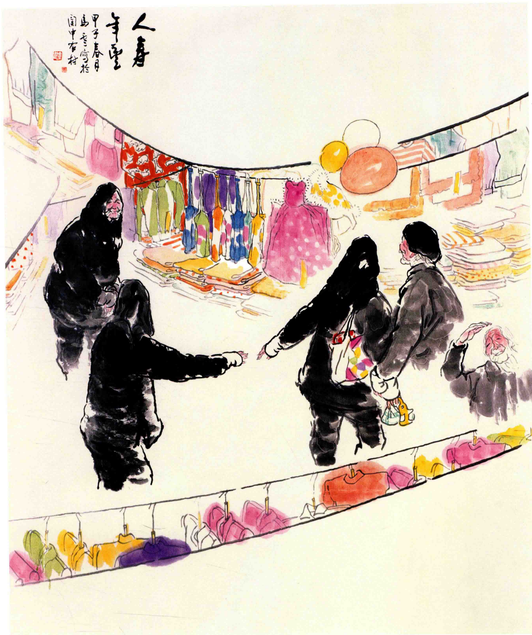
◇ 人寿年丰 1984年 纸本