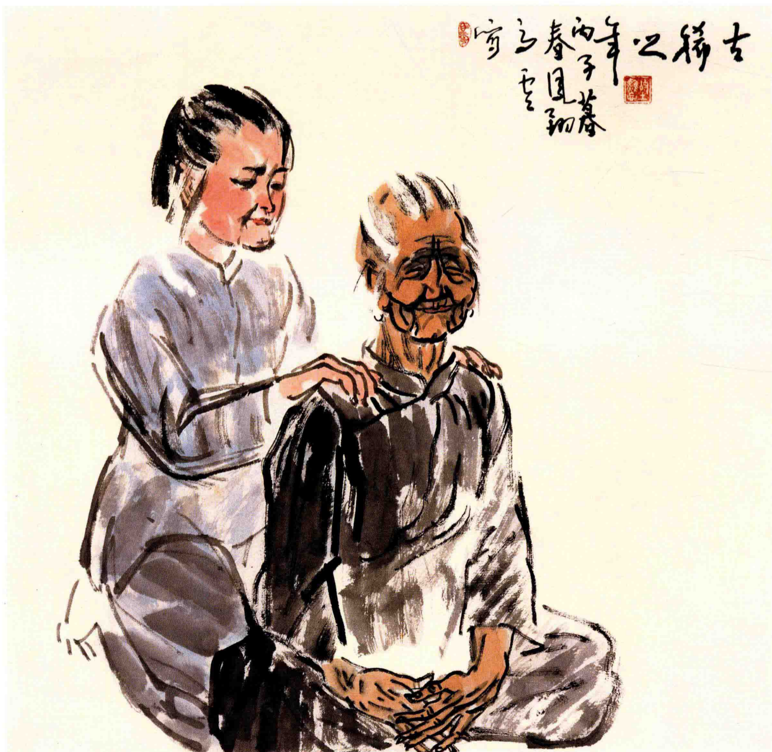
◇ 亲情 1996年 纸本