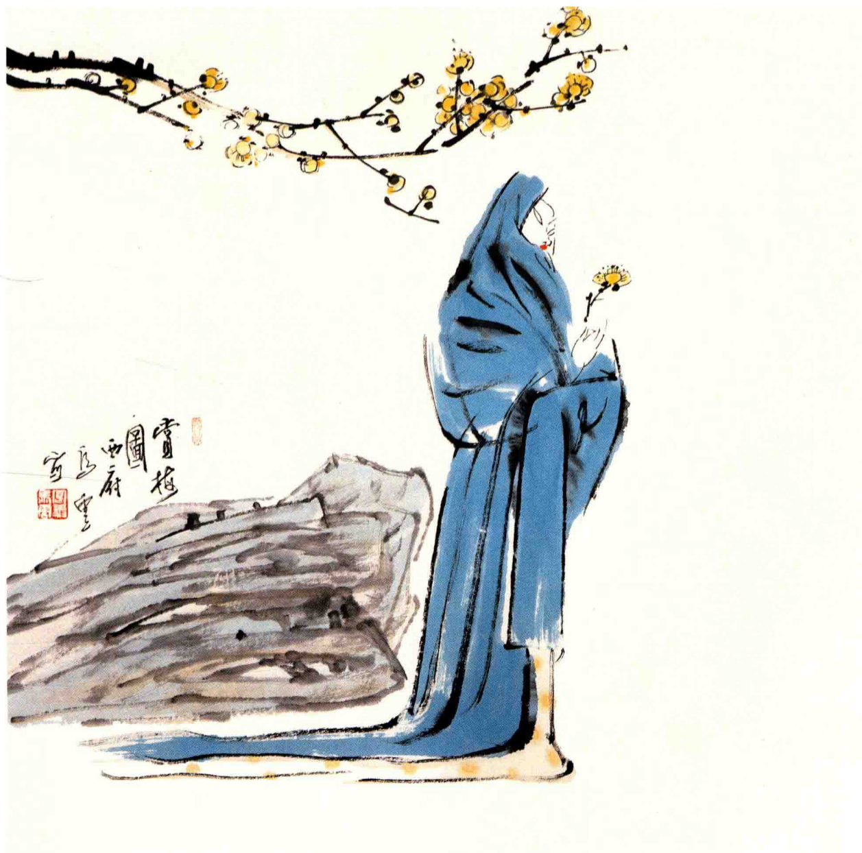
◇ 赏梅图 2004年 纸本