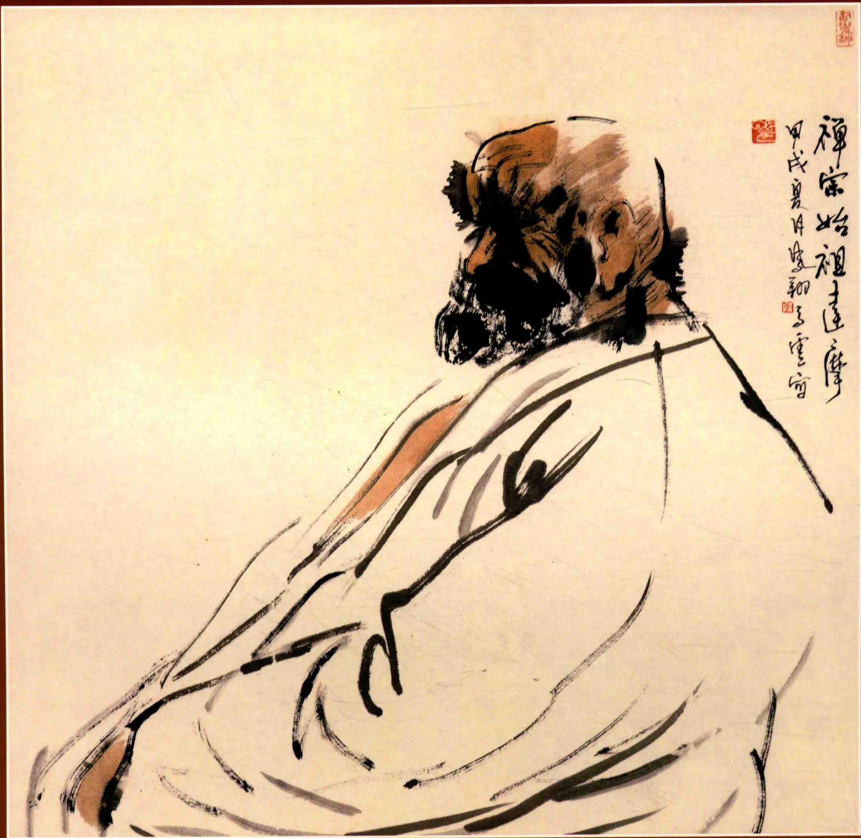
◇ 禅宗始祖达摩 1994年 纸本