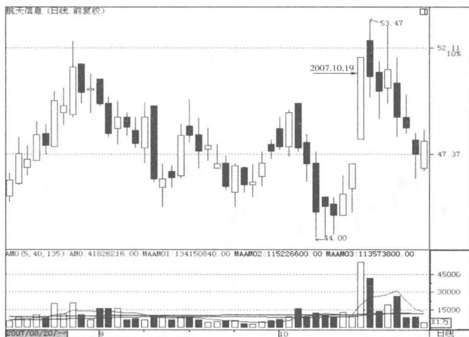
图 2-2 跳空长阳