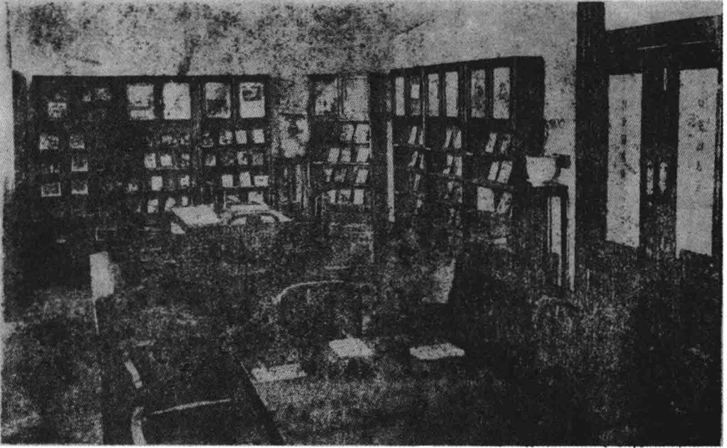
室書圖童兒館書圖立市海上