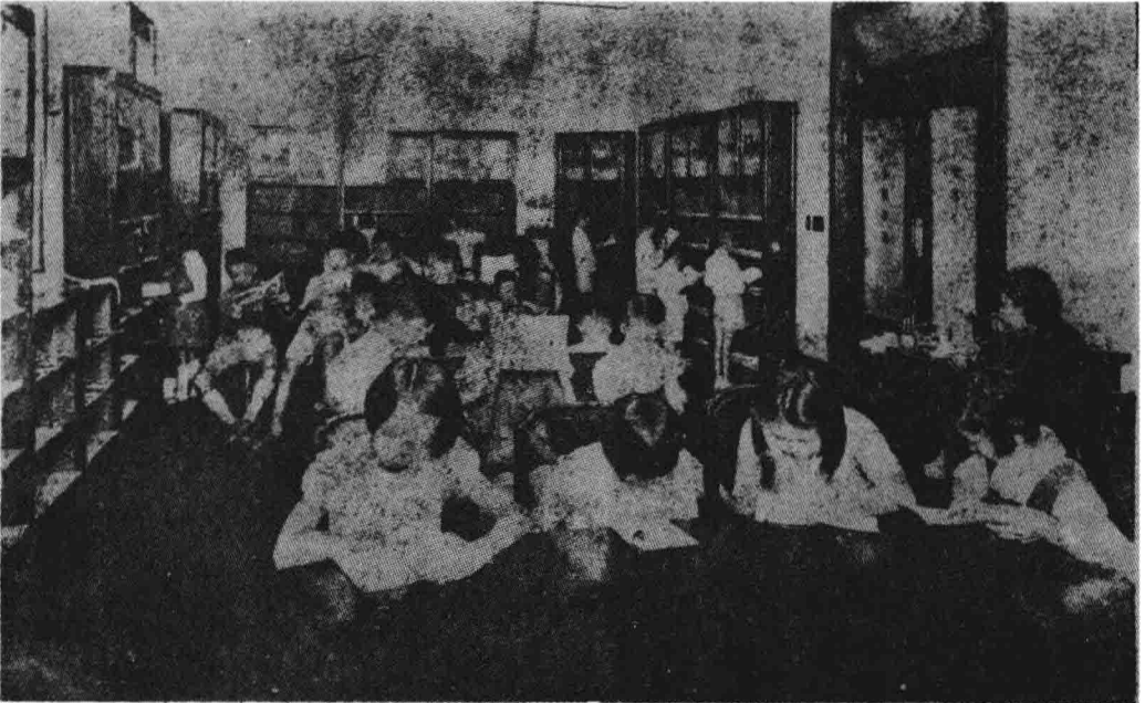
形情覽閱室書圖童兒館書圖立市海上