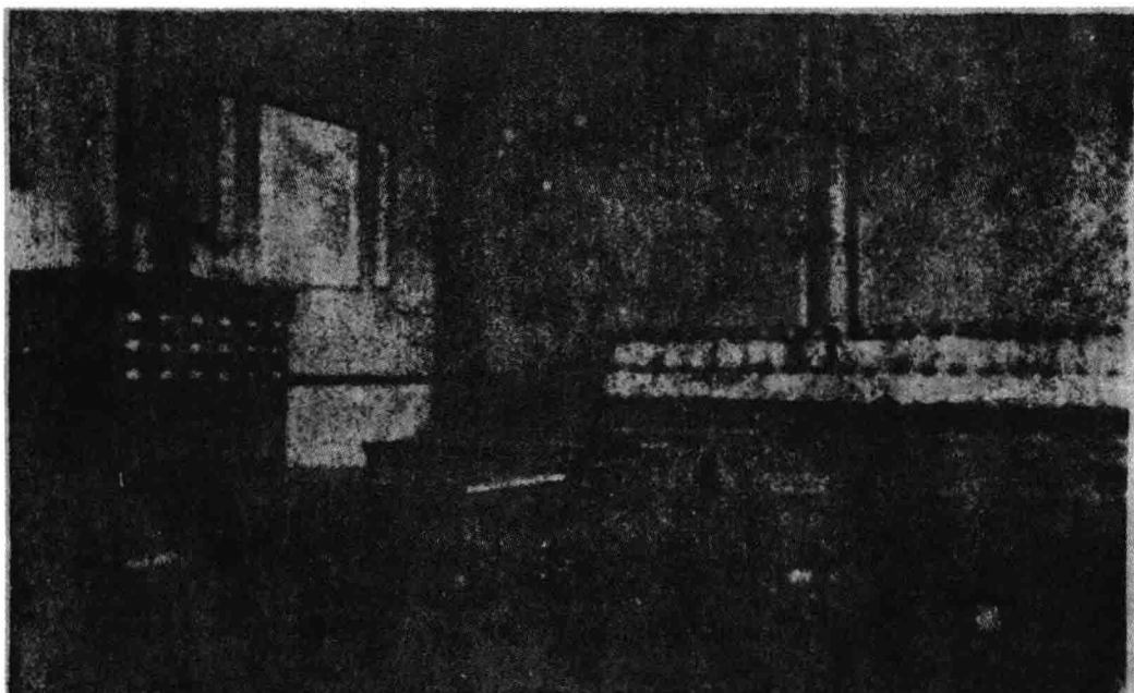
北平市立第一普通圖書館兒童閱覽室之一角