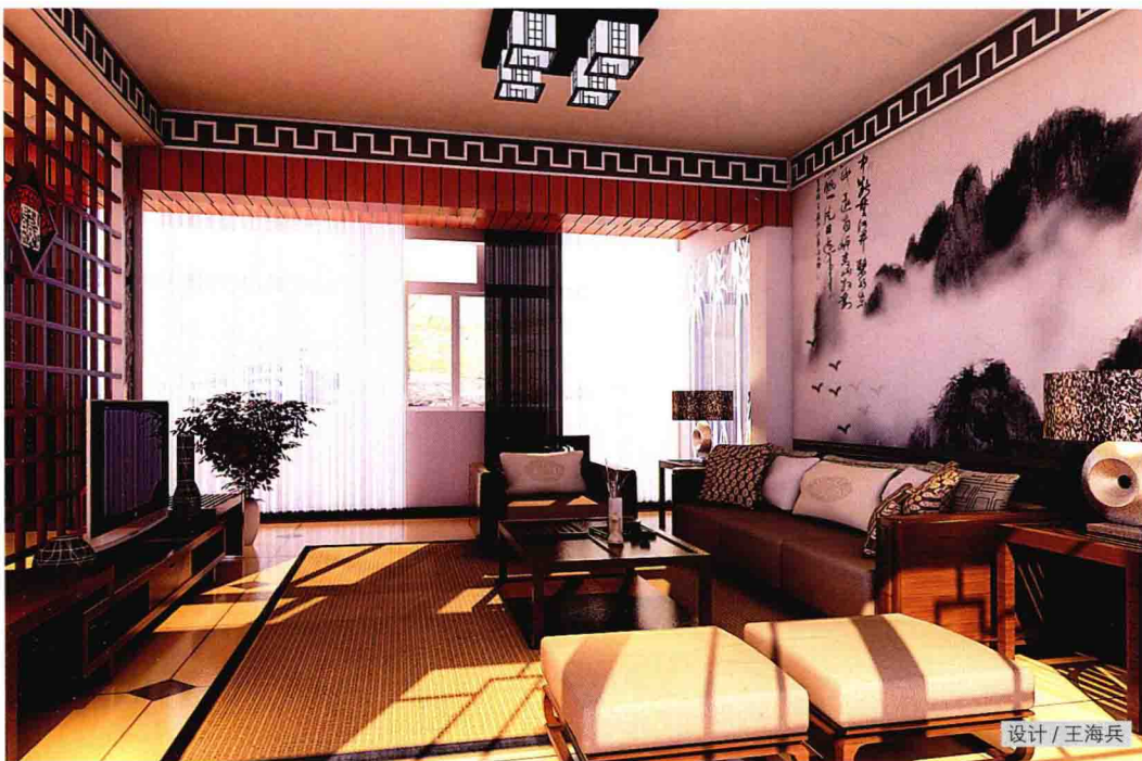
◀ 简约的无吊顶设计搭配中式元素的吊灯和墙线，塑造新中式风格的时尚与大气。