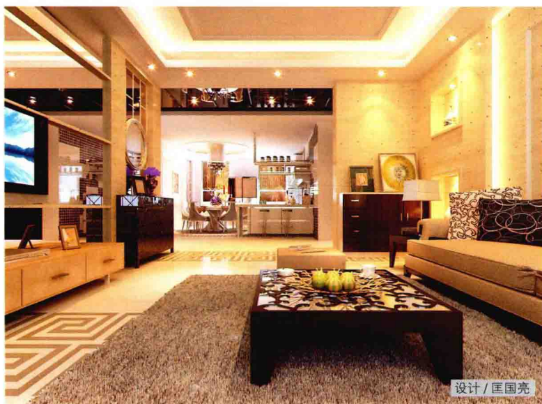
▲ 天花是居室空间中客厅的视觉焦点，采用欧式古典吊顶形式配以豪华水晶灯，在整体沉稳内敛的空间中显示出独特的创意魅力。