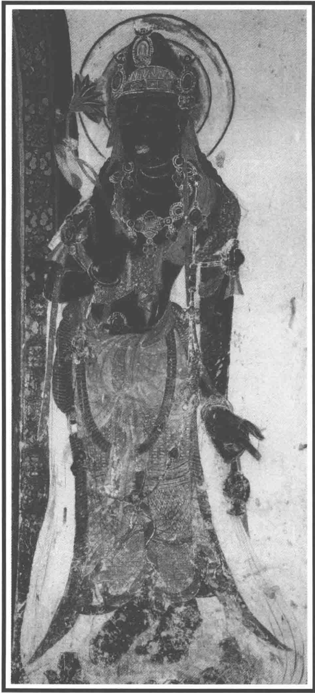
观世音菩萨·莫高窟（盛唐）