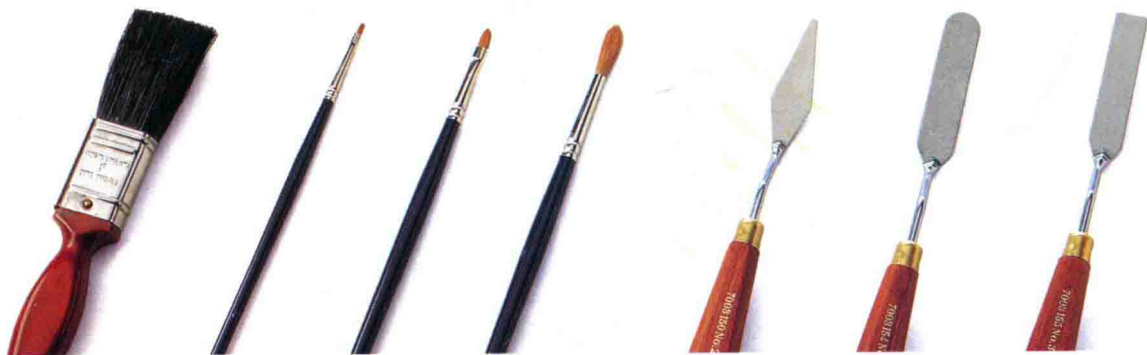
一系列不同形状的画刀

2.5 厘米（1 英寸） 用于涂色以及绘制 底漆的涂料刷 3 号短平头 / 方头黑貂 毫毛画笔 6 号棒形 黑貂毫 毛画笔 8 号圆头 黑貂毫 毛画笔