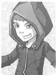
丹·卡希尔 ( Dan Cahill )

十四岁，有一头棕红色长发和翠绿色的眼珠。葛蕾丝的外孙女。内向腼腆，不善与人交流，隐藏自己情绪的方法是沉浸在书堆里，最爱待在图书馆，酷爱阅读。