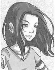
艾米·卡希尔 ( Amy Cahill )

十四岁，有一头棕红色长发和翠绿色的眼珠。葛蕾丝的外孙女。内向腼腆，不善与人交流，隐藏自己情绪的方法是沉浸在书堆里，最爱待在图书馆，酷爱阅读。