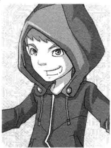
丹·卡希尔 ( Dan Cahill )

十四岁，有一头棕红色长发和翠绿色的眼珠。葛蕾丝的外孙女。内向腼腆，不善与人交流，隐藏自己情绪的方法是沉浸在书堆里，最爱待在图书馆，酷爱阅读。