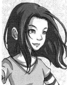
艾米·卡希尔 ( Amy Cahill )

十四岁，有一头棕红色长发和翠绿色的眼珠。葛蕾丝的外孙女。内向腼腆，不善与人交流，隐藏自己情绪的方法是沉浸在书堆里，最爱待在图书馆，酷爱阅读。