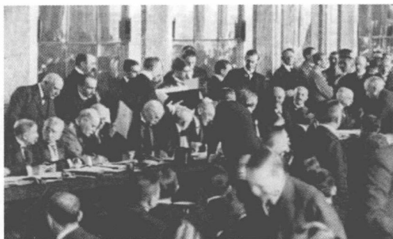
各国签订《凡尔赛和约》

《凡尔赛和约》是德国第一次世界大战战败的产物，是法、英、美三国为掠夺德国的经济，经过激烈讨价还价的结果。法国企图通过肢解德国和向其索取大量赔款，将德国这个宿敌彻底打垮。英国