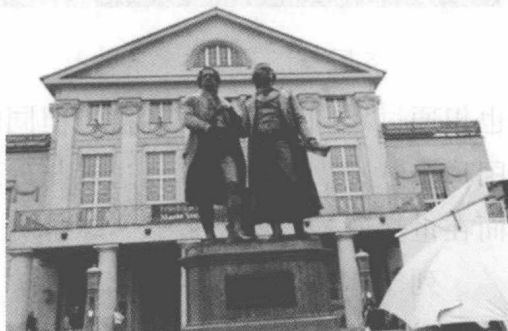
魏玛共和国诞生地——德国魏玛

1919年2月6日，德意志国民议会在德意志中部小城魏玛召开，制定了德意志历史上第一个共和国宪法。同年8月14日宪法生效，标志着魏玛共和国的诞生。至1933年1月30日希特勒攫取总理职位，魏玛共和国寿终正寝，历时仅14