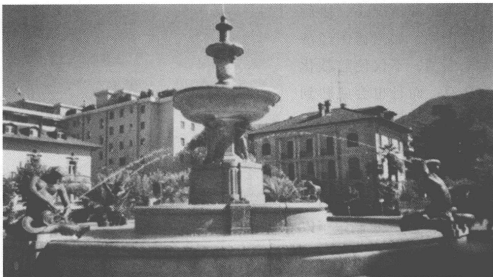
《洛迦诺公约》签署地瑞士洛迦诺

为摆脱内外交困的局面，魏玛共和国开展积极外交，其中主要是处理与法国和苏联的关系。法国与德国曾在历史上多次兵戎相见，宿怨极深。魏玛政府明白，要想加入国际联盟等国际组织以突破束缚，必须首先改善与法国的关系。在这个问题上，德国充分利用了协约国之间的矛盾，尤其是利用了英国反对法国称霸欧洲的心理。