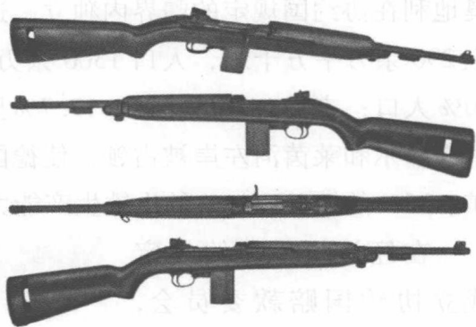
旧式 M1 卡宾枪

关于陆军体制编制，《凡尔赛和约》规定，德意志陆军必须编7个步兵师和3个骑兵师，隶属于2个军司令部。此外，和约还规定了各师所辖军官、士官、士兵人数，甚至对各分队的人数也做了具体规定。对军队的教育训练