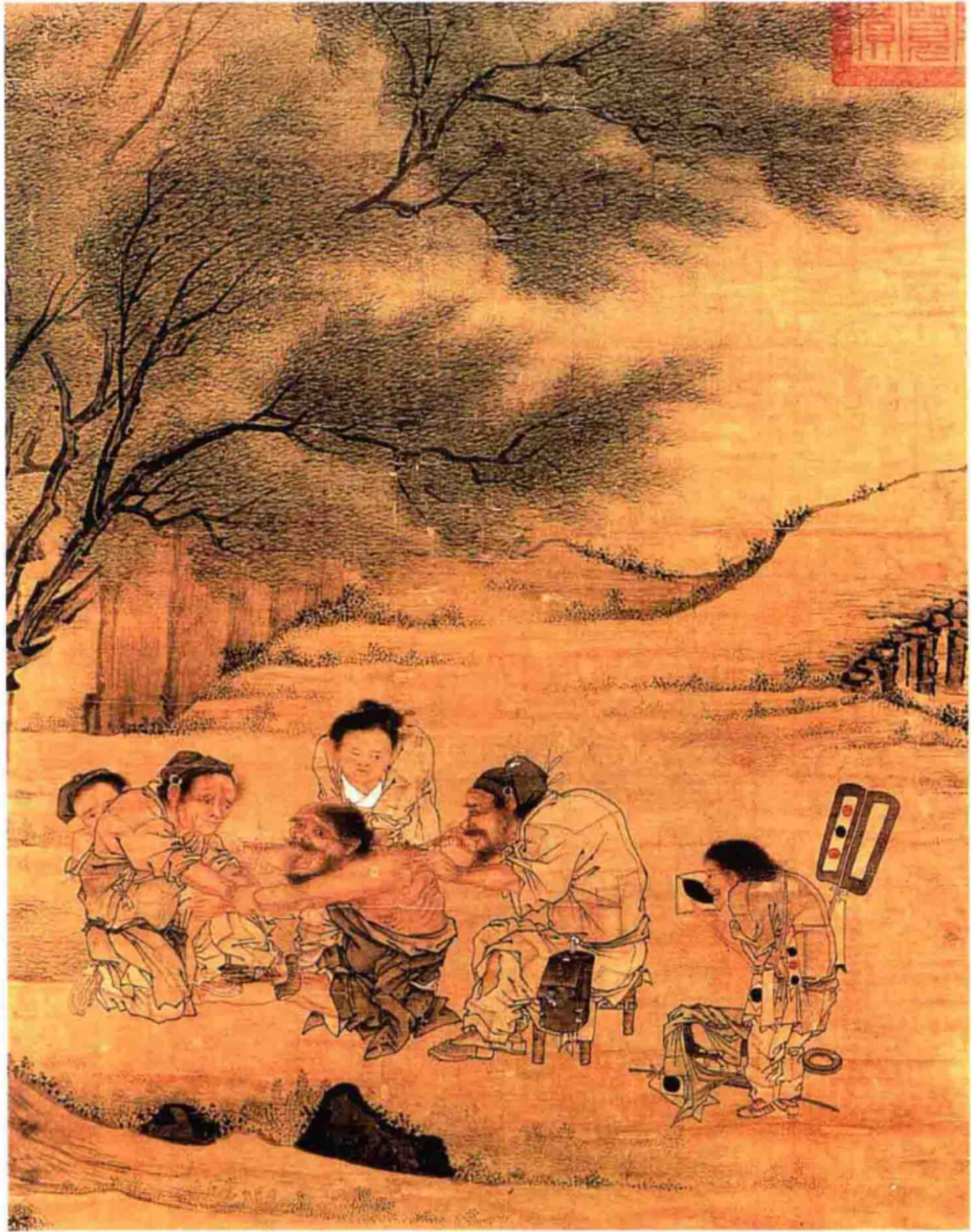
宋·李唐 村医图（描绘古代灸背及膏药贴敷治疗情景）