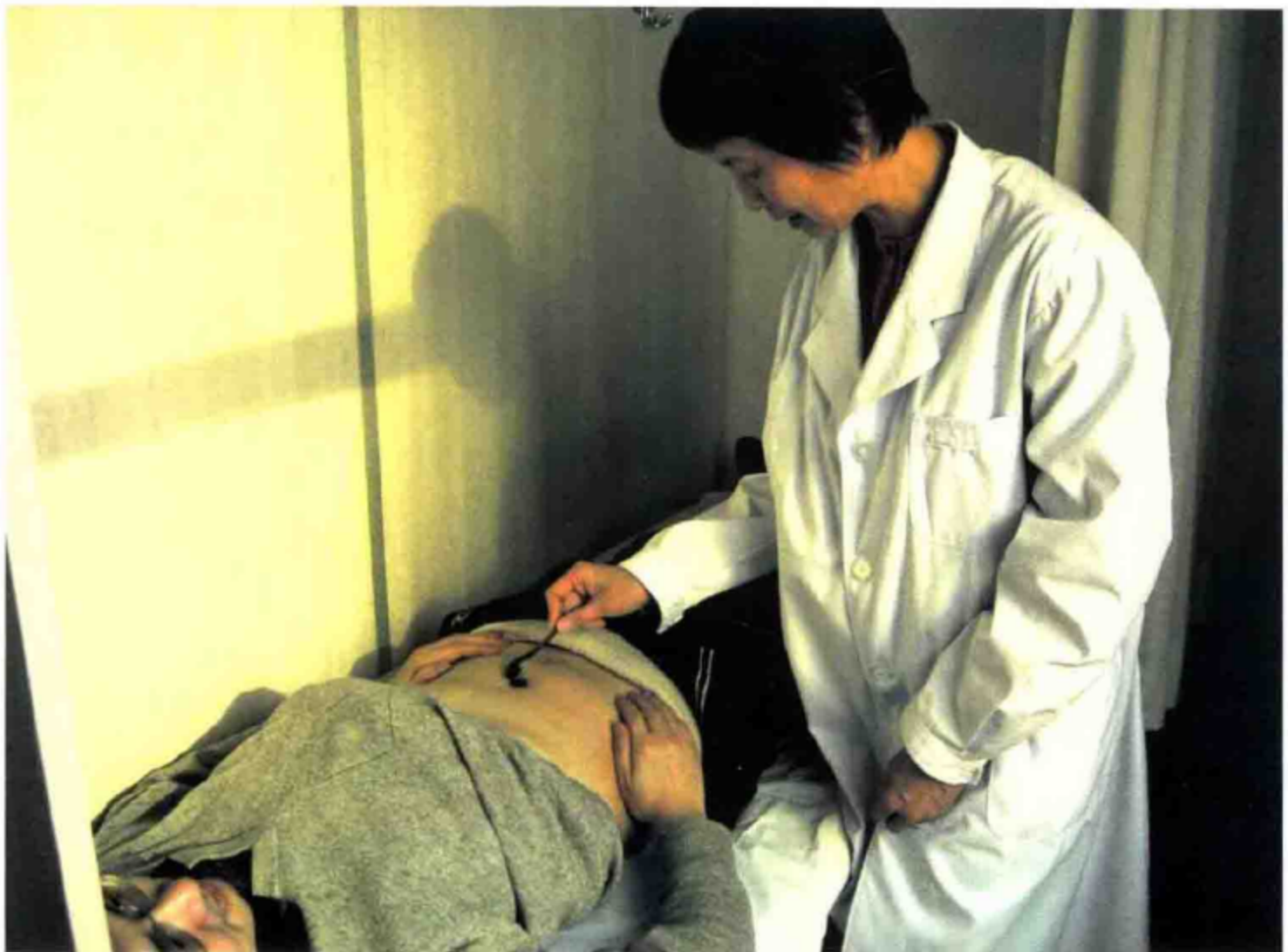
暖脐膏敷脐（神阙穴）治疗腹泻