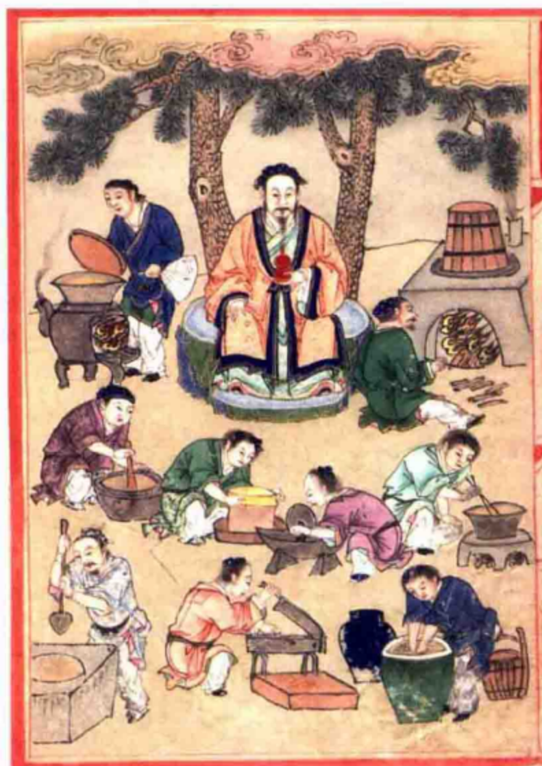
古代膏方制作流程图（引自《补遗雷公炮制便览》）