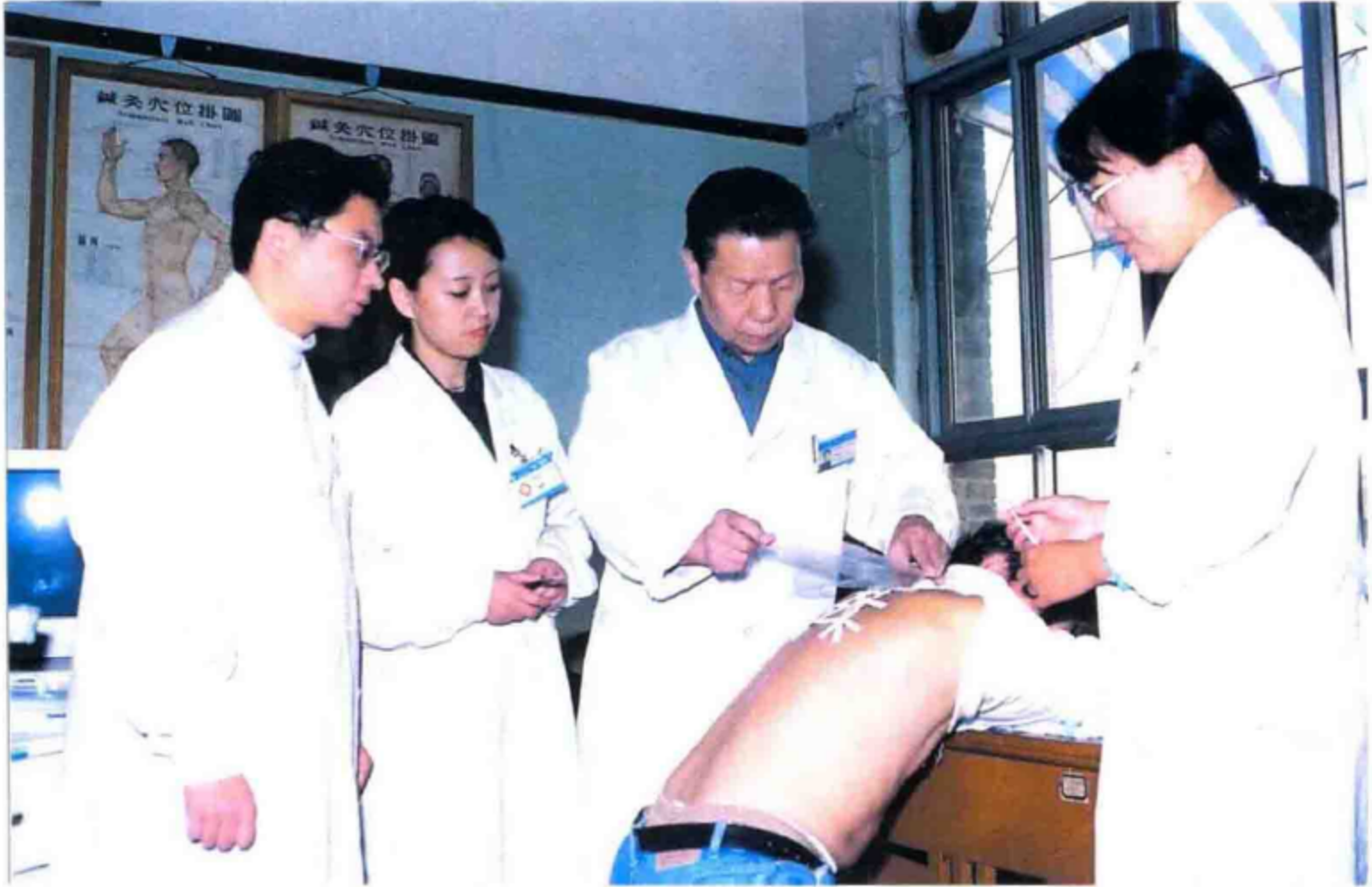
田从谥与其学术继承人、研究生一起开展冬病夏治穴位贴药治疗