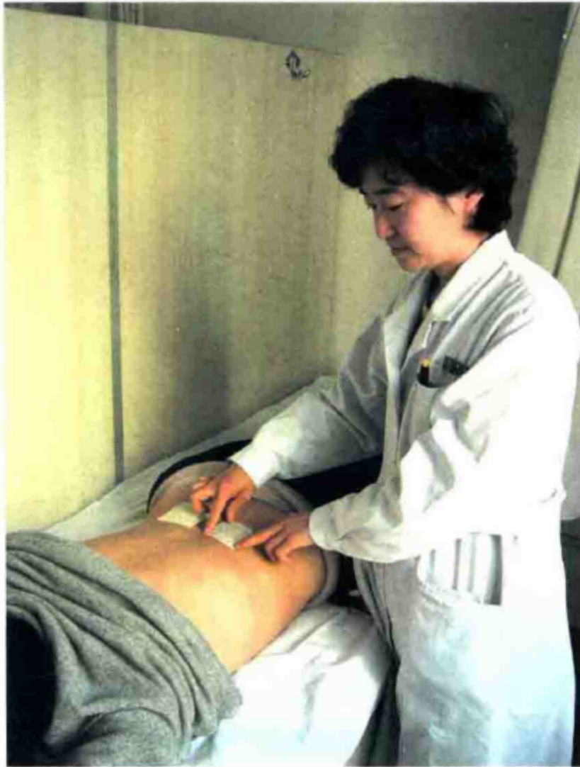
强肾壮骨膏贴敷肾俞穴治疗慢性腰痛