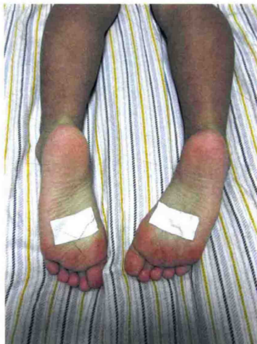
吴萸散贴敷涌泉穴治疗小儿口腔溃疡