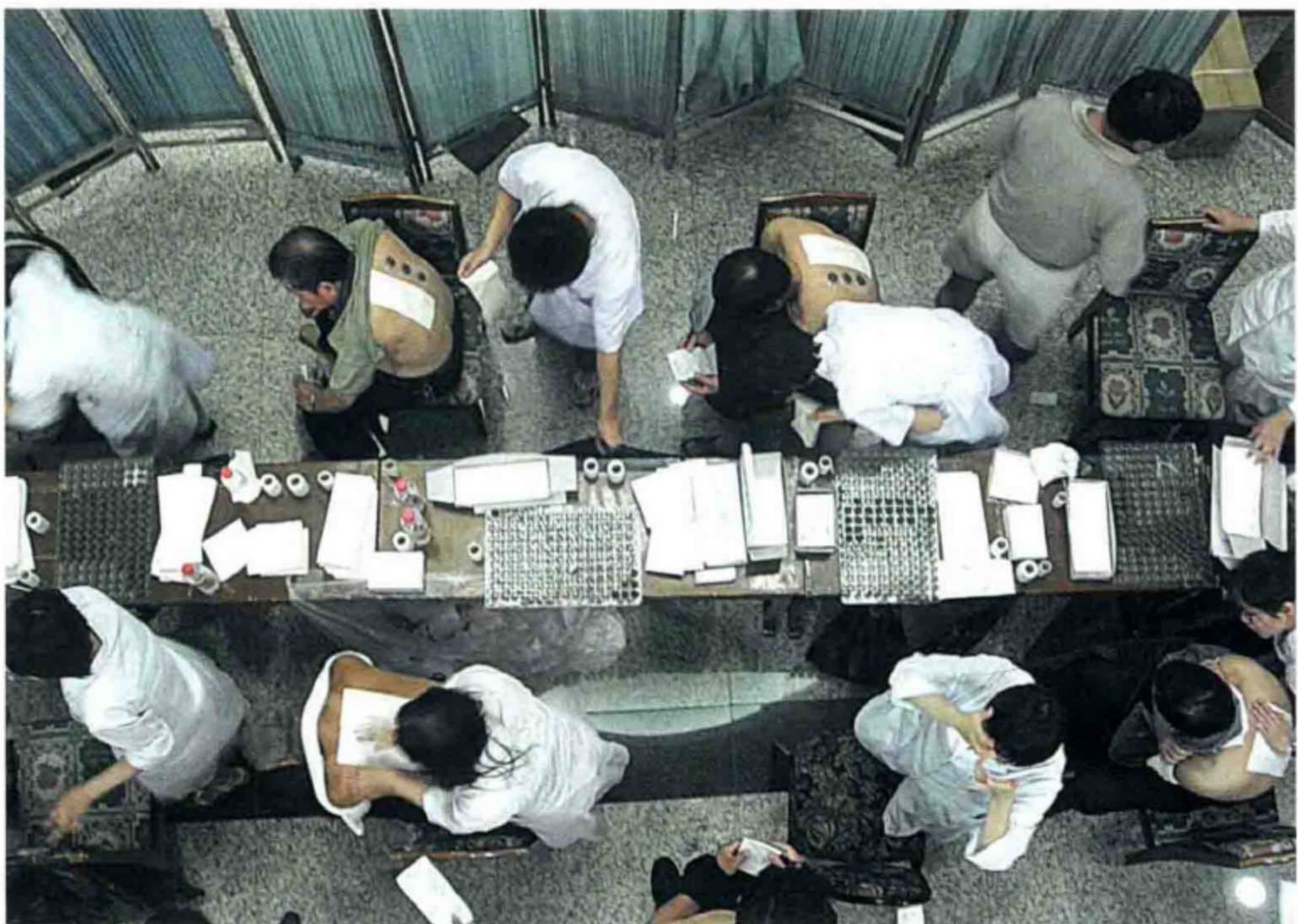
中国中医科学院广安门医院“冬病夏治三伏贴”治疗盛况