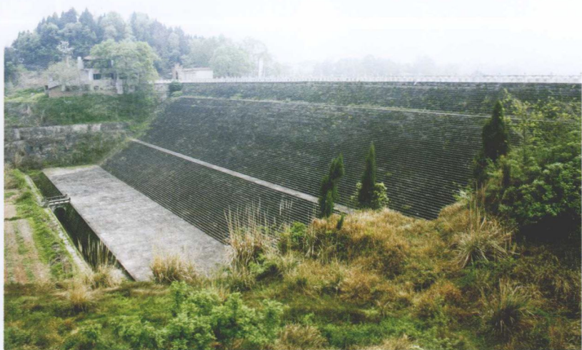
壮观的赤城湖大坝