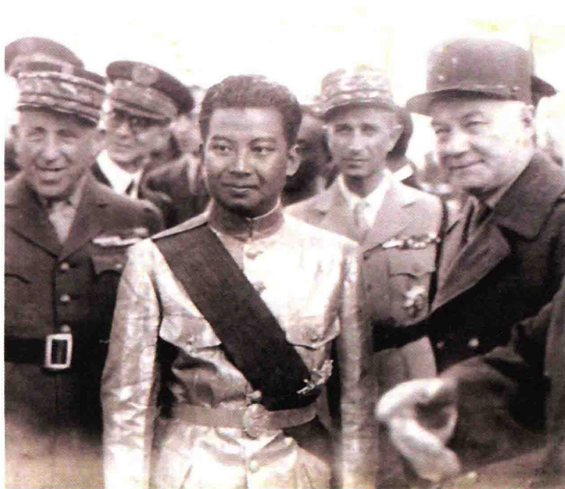
国王陛下和法国官员们