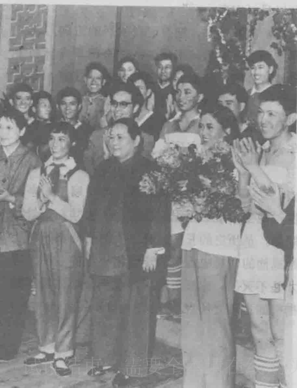
宋庆龄和上海儿童艺术剧院的演员们在一起。