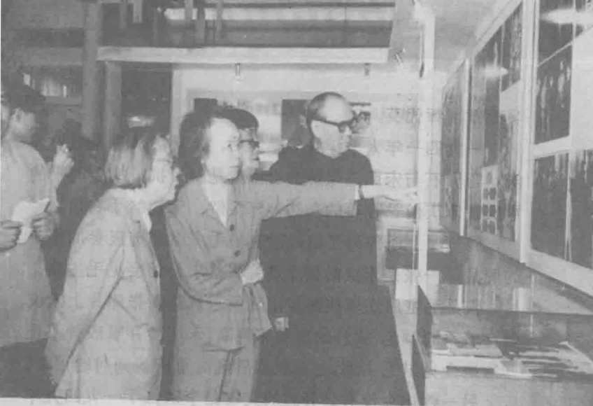
邓颖超、乌兰夫等同志参观宋庆龄故居