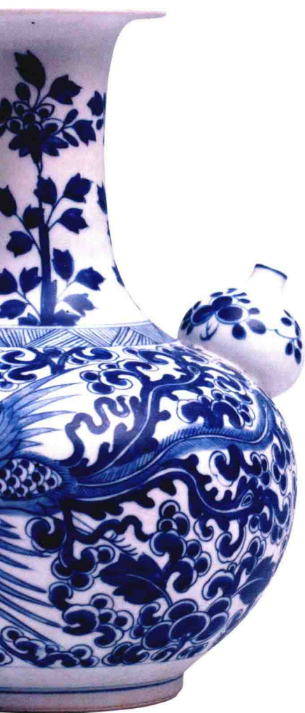
杭州南宋官窑博物馆藏 清代外销青花瓷精品