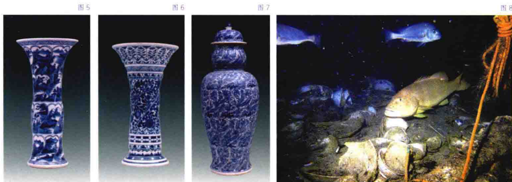
图1: 青花童子春牧盘 图2: 青花西洋宫苑盆景高奘大盖罐 图3: 青花殷实铃铛杯 图4: 青花凤穿过枝牡丹军持 图5: 青花莲瓣漂影开光景行花觚 图6: 青花折枝花卉花觚 图7: 青花漂影开光花卉盖罐 图8: 海底沉船内被茶叶覆盖着的瓷盘