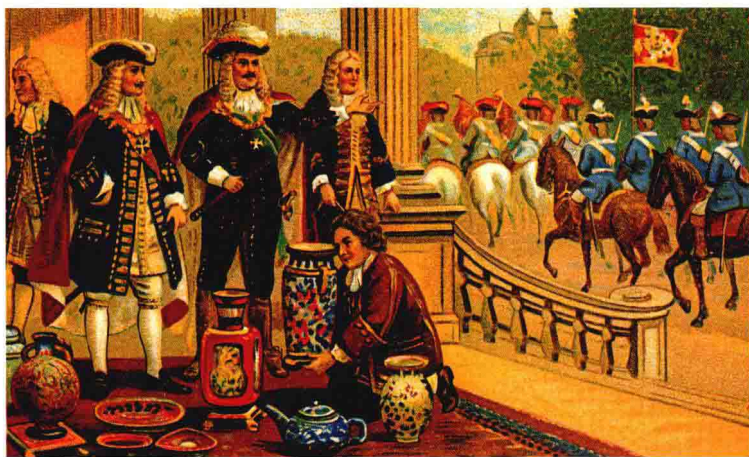
图1：1717年，为了得到普鲁士帝国腓特烈·威廉一世的127件中国瓷器，奥古斯都二世竟然以600名全副武装的萨克森近卫骑兵去交换，那些瓷器的价值相当于27000塔里尔（德国旧银币），在当时是一个天文数字。这些身价不菲的瓷器因此被称作“近卫花瓶”，至今仍陈列在德国德累斯顿茨温格尔宫博物馆内。

在皇室、贵族奢华之风的引领下，欧洲社会的生活方式乃至审美观念，都围绕中国瓷器发生了些许变化。瓷质餐具以其材料的特殊性与外观的独特性，迅速取代了木制、锡制、银制餐具，成为欧洲烹饪艺术中的重要组成部分。同时，欧洲人还养成了使用成套餐具的习惯，在向中国定制瓷器时，往往要求大小不等的碗、盘、杯、调味瓶、烛台、水壶等样样具备。能够使用成套的中国瓷器来招待客人，成为一个家庭身份地位的象征。17世纪初的欧洲人甚至相信，用瓷器来吃饭喝水，可以强身健体，瓷器碰到毒药会马上