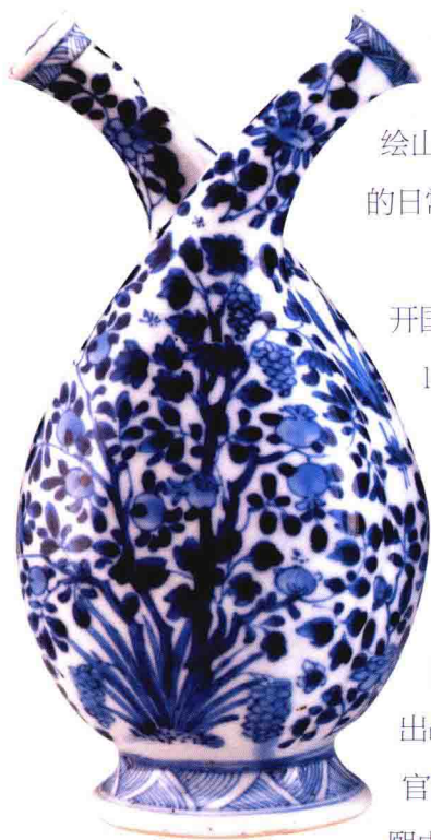
图6：清 景德镇窑青花果树枝纹双管瓶 上海博物馆藏

杭州南宋官窑博物馆收藏的这一批外销青花瓷，正是清康熙年间取消海禁后出海的产品。而此时，外销青花瓷的主要供应源——景德镇民窑业，也正逐渐走出战乱带来的黑暗期。清康熙十九年（1680年）至康熙二十七年（1688年），朝廷派官员前往浮梁，监督烧造宫廷使用的瓷器，景德镇走向皇家御器烧造的高峰。直至康熙中期，生产外销瓷的民窑开始迅猛发展并有大量瓷器出口海外，亚非欧地区都发现了数量相当多的该时期的景德镇瓷器。这一次海禁的开放，不仅带来了中国外销瓷的复