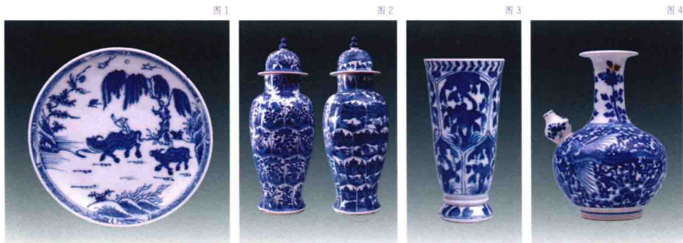
图1（见182页）的青花童子春牧盘的纹样是中国传统纹样的代表。画面上，旭日高升，一对春燕随童子春牧，草帽俏皮地飞上蓝天，草帽、春燕和牧童都呼应着一枝杏花。在古代工艺品上，经常有牧童骑在牛背上放风筝的形象，红日高照，祥云缭绕，寓意青云得路，象征官高爵显，一帆风顺。这件青花瓷上，将风筝换为牧

中国外销瓷最兴盛的时期是17世纪至18世纪前十年。17世纪前八十年，当时的欧洲还不能生产硬质瓷（porcelain），中国此时正处于明官窑停烧（1607年停烧），民窑在改朝换代的动荡中萎缩的局面。在历史的罅隙中，中国外销瓷逐渐畅销欧洲上流社会，被视为财富和地位的象征。明末清初外销瓷的盛况，不仅给中国带回了大量白银，而且也使得江西景德镇、福建德化等地的瓷业持续发展，为清康熙二十年（1681年）至乾隆朝（1736—1795年）的瓷业三重唱奏响了序曲。清康熙十九年（1680年），清朝廷平定了吴三桂叛乱，标志着从这一年到乾隆朝中国古代社会进入盛世。国泰民安，国富民足，国强文昌，清康熙朝官窑生产也在这样的大背景下走上正轨。这一时期的中国瓷业，是一曲气势恢宏的三重唱，官窑瓷、民窑瓷和外销瓷，这三个声部由官窑瓷领衔，民窑瓷铺展，外销瓷和声，本书中的106件器物就是和声中几个跳动的音符，其中的克拉克瓷是古陶瓷爱好者熟悉的旋律。这些外销瓷的造型和纹饰大致可以分为三类：一类是中国传统风格，一类具有中西合璧特色，还有一类则为纯粹西方的面貌。外销瓷的造型有碗、平盘、折沿盘、碟以及各色（盖）杯、花觚、瓶、盖罐、茶壶等，纹样题材有仕女、婴戏、花鸟、龙凤、亭台楼阁、山水等，它们互相组合，每翻一页，都给人以耳目一新之感。