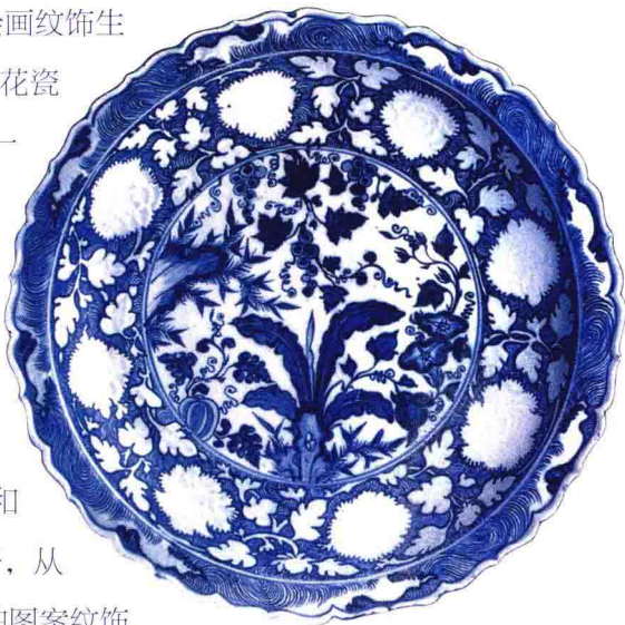
图4：元 青花蕉石瓜果纹大盘 土耳其托普卡比博物馆藏

明清时期是青花瓷器达到鼎盛又走向衰落的时期。明永乐、宣德时期是青花瓷器发展的一个高峰，以制作精美著称（图5）；清康熙时以五彩青花使青花瓷发展到了巅峰，清乾隆以后因粉彩瓷的发展而逐渐走向衰退。17世纪至18世纪，中国外销瓷器贸易达到极盛时期。大量的中国瓷器行销到世界各地，也是在这个时期。除了具有中国风格的瓷器源源不断地从海上、陆上的“丝绸之路”远销各国，走向欧洲的外销青花瓷在这个时期出现了独特的异国风格。为了适应海外市场的需求，符合外国人的审美习惯和生活习俗，