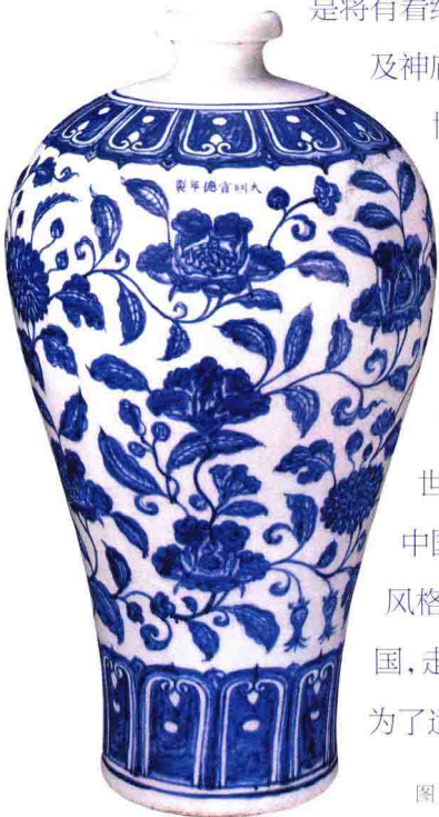
图5：明 青花缠枝花卉纹梅瓶 故宫博物院藏