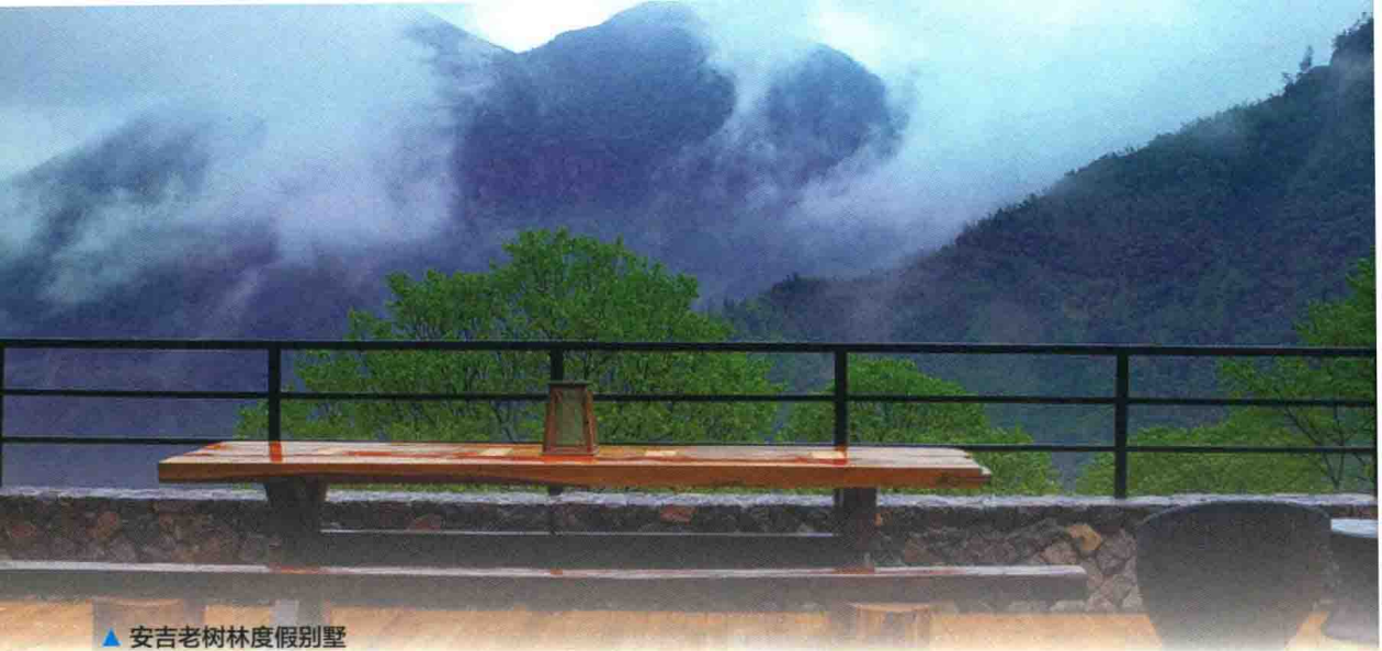
▲安吉老树林度假别墅

湖州，地处太湖南岸，是一座具有 2300 多年历史的江南古城，素有“丝绸之府、鱼米之乡、文化之邦”之美誉，宋代便有“苏湖熟，天下足”之说，是湖笔文化的诞生地、丝绸文化的发源地、茶文化的发祥地，是环太湖地区唯一因湖而得名的城市，下辖德清、长兴、安吉三县和吴兴、南浔两区，面积 5818 平方公里，人口 290 万。湖州位于长江三角洲中心腹地，交通十分便捷，距沪、宁、杭、苏、锡、常等大城市均在 2 小时车程以内。湖州生态环境优良，全市森林覆盖率达 51%，西部山区近 70%。“中国竹乡”安吉是全国首个生态县，德清、长兴均为省级生态县，全市拥有全国环境优美乡镇 20 个，居全省之首。元代诗人戴表元曾留下诗句：“山从天目成群出，水傍太湖分港流，行遍江南清丽地，人生只合住湖州。”近年来，在湖州市委、市政府强力推动下，新农村建设成就已转化为湖州乡村旅游发展的产业优势，德清县的“洋家乐”，长兴县的“上海村”，安吉县的“美丽乡村”，吴兴区和南浔区的“休闲农庄”等乡村度假产品，在全省乃至长三角都具有一定的知名度和影响力。目前，全市农家乐达 3200 余家。2013 年，全市乡村旅游接待游客 1310 万人次，同比增长 13.21%；直接经营收入 15.43 亿元，同比增长 19.15%，带动农民人均增加收入 769 元，占年度农民人均收入增加量 1856 元的 41.43%。湖州充分利用太湖、古镇、名山、湿地等优势资源，集中展现生态、文化、宜居、乐活的乡村特色，形成了独具魅力的竞争优势，“乡村旅游在湖州”的品牌已经形成。湖州市先后获得国际生态休闲示范城市、中国优秀旅游城市等称号，在全省率先实现省级旅游经济强县全覆盖。2012 年，安吉县在意大利第六届世界城市论坛上被联合国人居署评为“联合国最佳人居奖”，德清县莫干山被美国《纽约时报》推荐为“2012 年全球 45 个最值得一去的地方”之一。