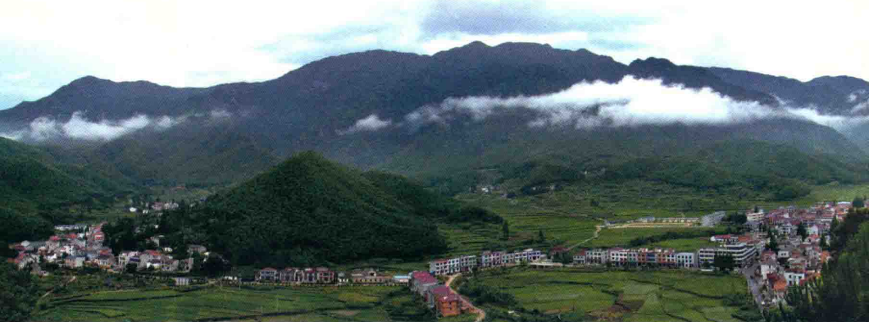
▲ 安吉县山川乡全景

湖州所开启的乡村度假新模式，其内涵是什么？有什么意义和价值？成功秘诀是什么？有什么规律、经验可供参考？未来的发展方向是什么？等等，带着系列问题，