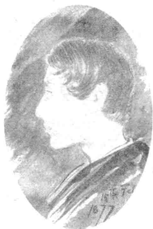
泰戈尔少年时的画像