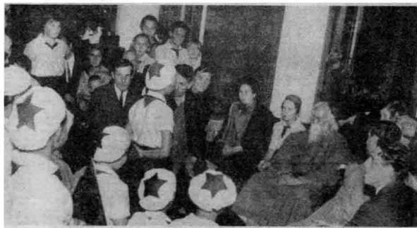
泰戈尔与少先队员们交谈（1930年）