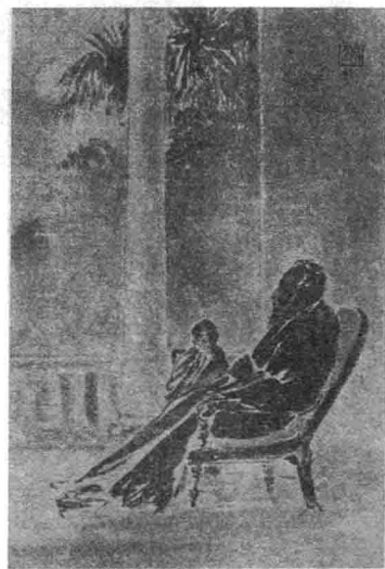
小泰戈尔和父亲坐在凉台上 (画像)