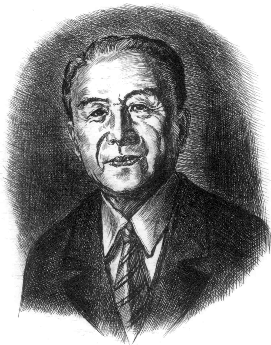
尊开沅先生，铜版画，2015，吴为山