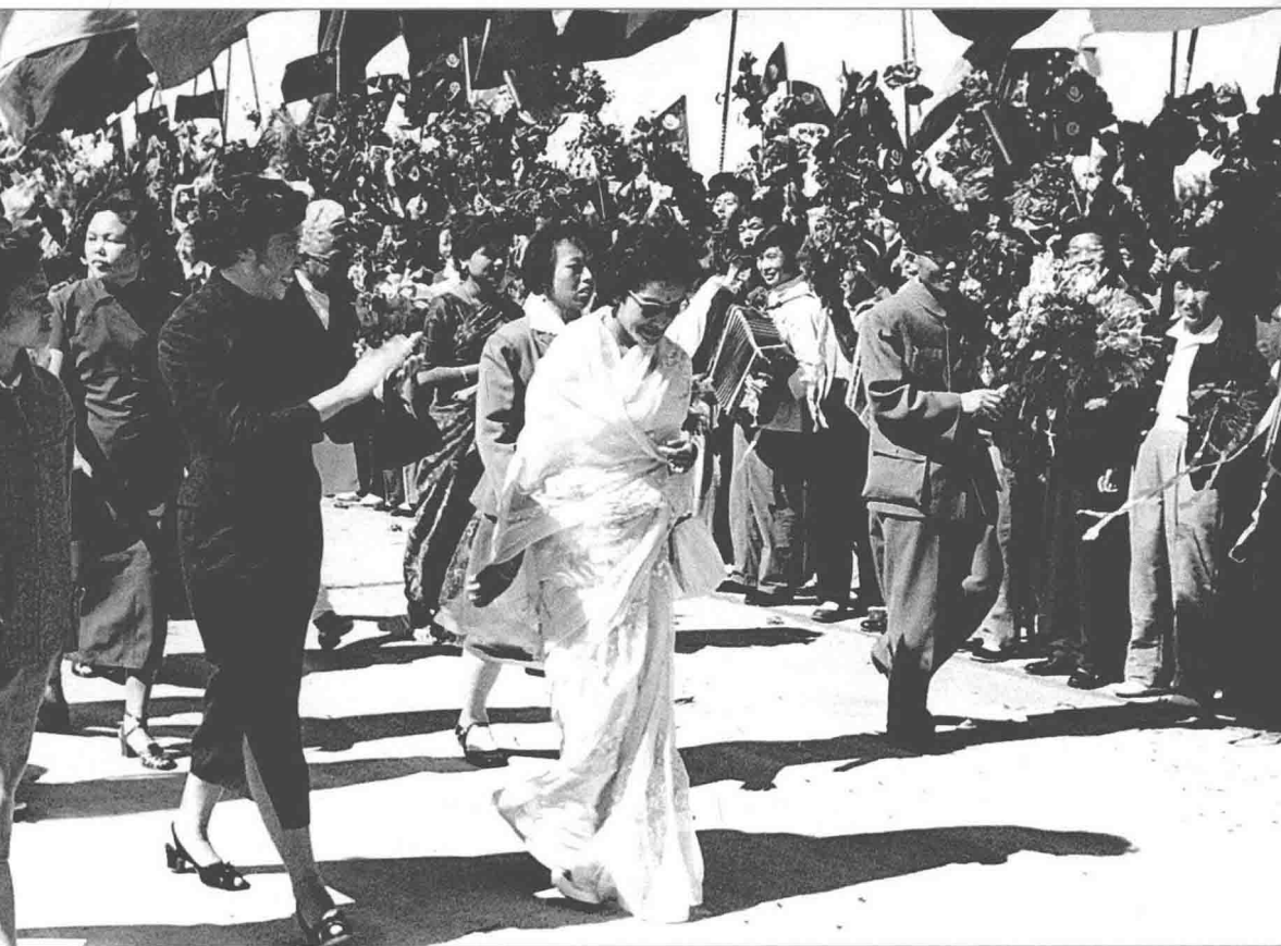
1961年9月，王光美欢迎尼泊尔王后来华访问