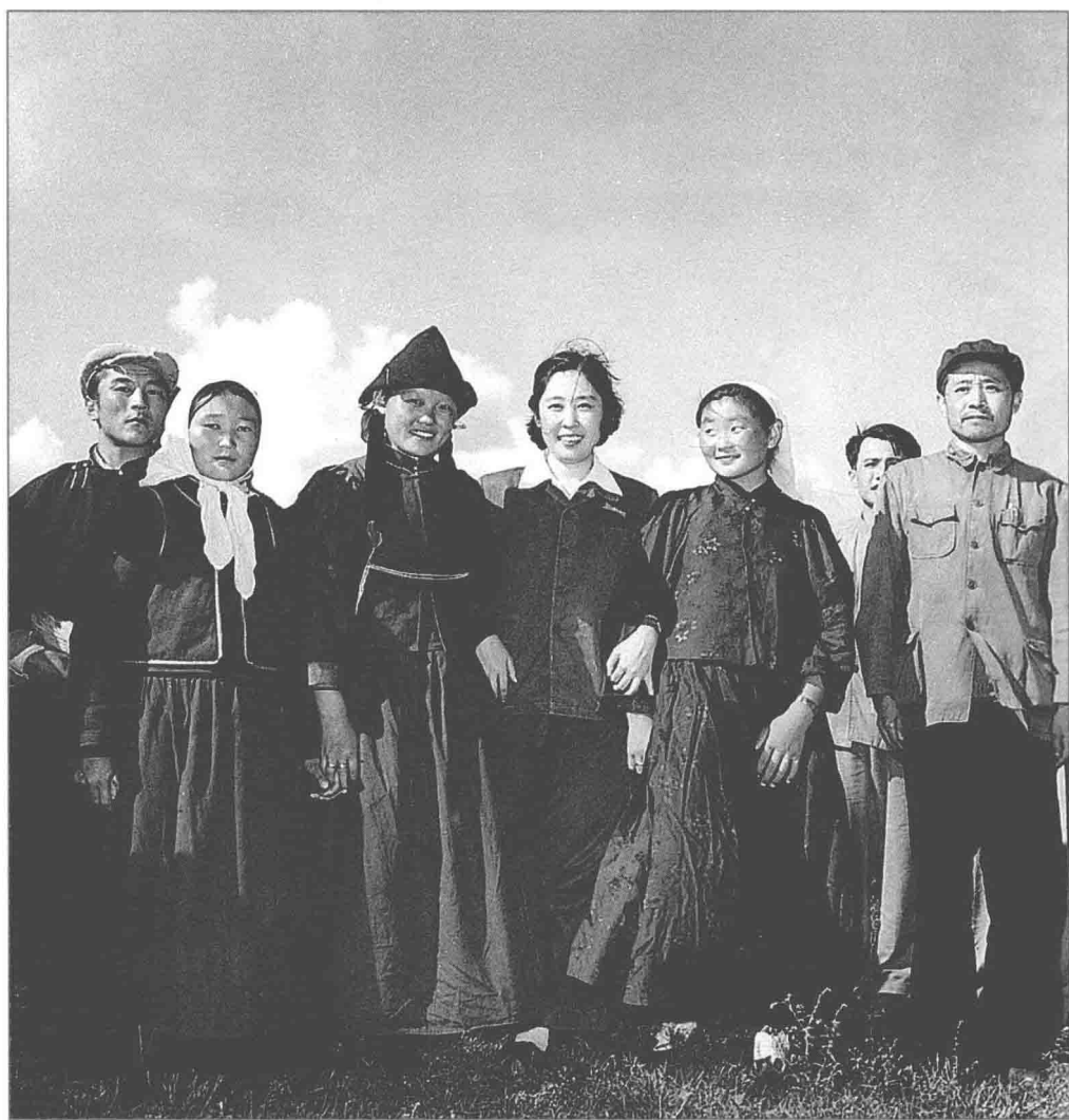
1961年，王光美在内蒙古农村与农牧民在一起