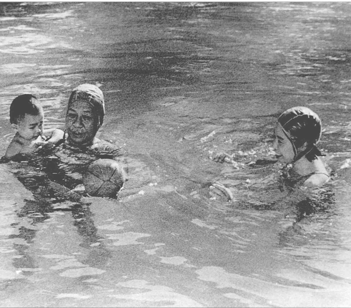
1961年夏，刘少奇、王光美与小女儿刘小小在游泳