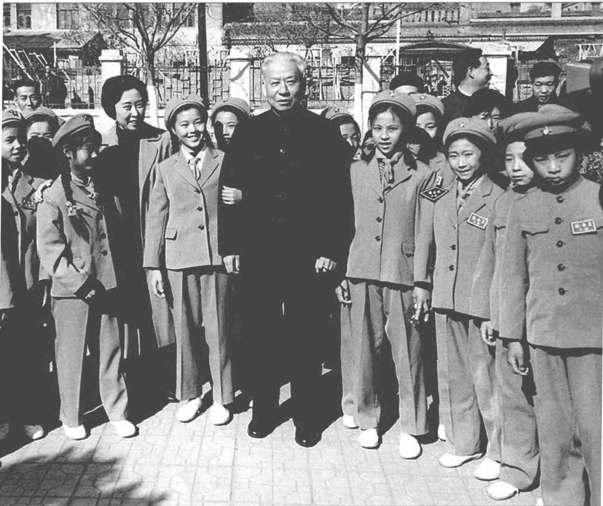
1965年10月，刘少奇、王光美在哈尔滨儿童公园