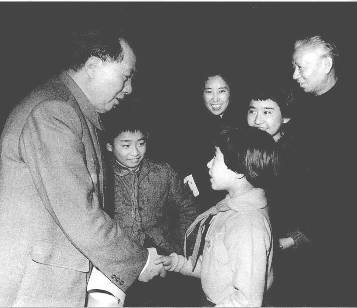
1962年，毛泽东、董必武看望刘少奇一家