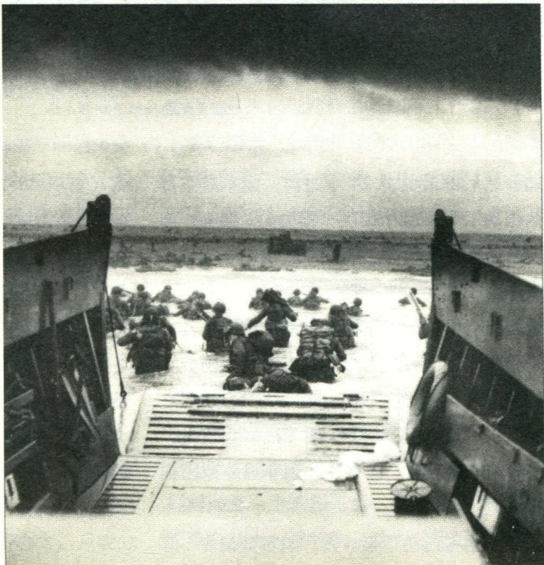
1944年6月6日诺曼底登陆开始