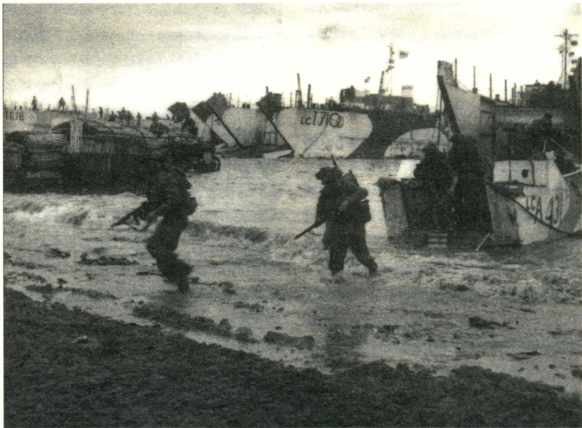
在诺曼底登陆的英联邦军队

陆开始后的最关键 24 小时内，盟军航空部队出动了 14 674 个架次（损失 127 架），而戈林所大肆吹嘘的德国空军只出动 319 个架次。由于遭到了盟军强大空中屏障的阻挡，更是只有少量德国飞机进入滩头地区，其中一些在飞行中被迫丢弃炸弹以逃避盟国战斗机的追杀。德国空军在空中完全没有还手之力，自身在第一天有 39 架飞机彻底损失，另有 21 架受创，其中 8 架因非战斗原因损毁 ② 。