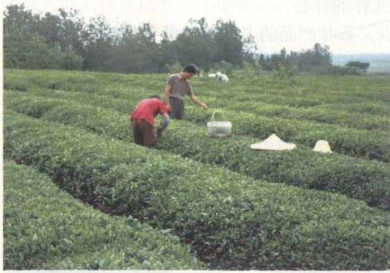
2000~2006年大陆茶叶生产情况

“十五”期间，大陆名优茶的产量从2000年的14.4万吨，增长到2006年的30万吨，增长了108.3%。名优茶的产值从55亿元，增长到2006年的150亿元。名优茶产值占总产值的比重逐年增加，到2006年，名优茶的产值已经占到茶叶总产值的81.0%。名优茶的快速发展已经成为提高茶叶行业经济效益的重要推动力量，它不仅增加山区农民的经济收入，帮助山区农民脱贫致富，而且还促进茶叶加工的进步和茶叶产业结构的调整。