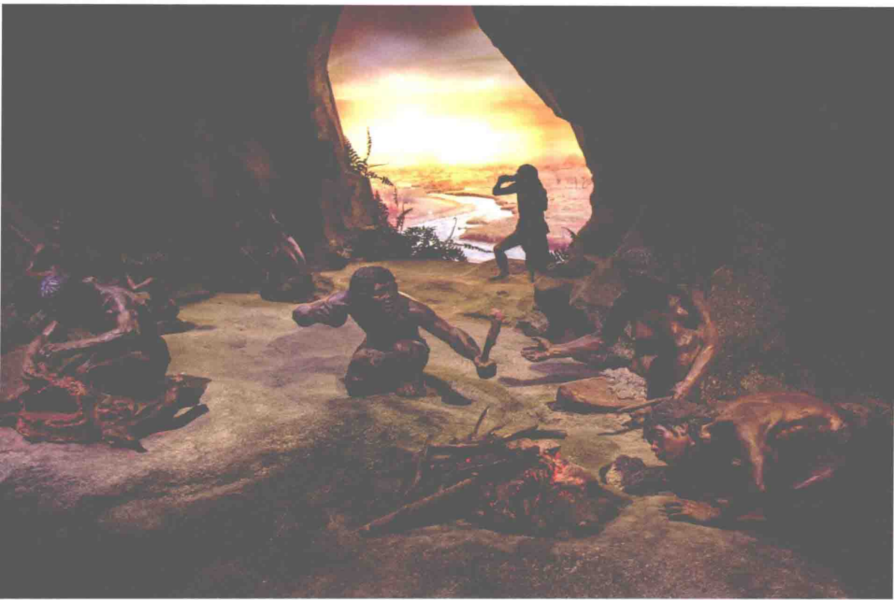
原始人头发自然披着，个个都像个汉子