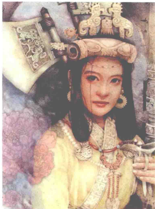
左图为出土的玉簪，右图为妇好