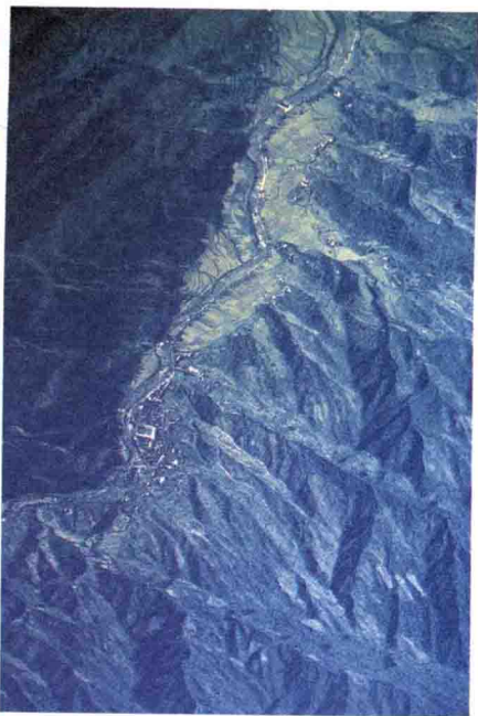
▲秦岭山脉是中国南北的分水岭

名字，准会以为山顶有积雪。所谓“太白积雪六月天”，是古代长安八景之一。其实山顶并没有终年不化的积雪，只不过是白色的岩石罢了。这里当然也没有现代冰川，只有一些古冰川活动的遗迹。